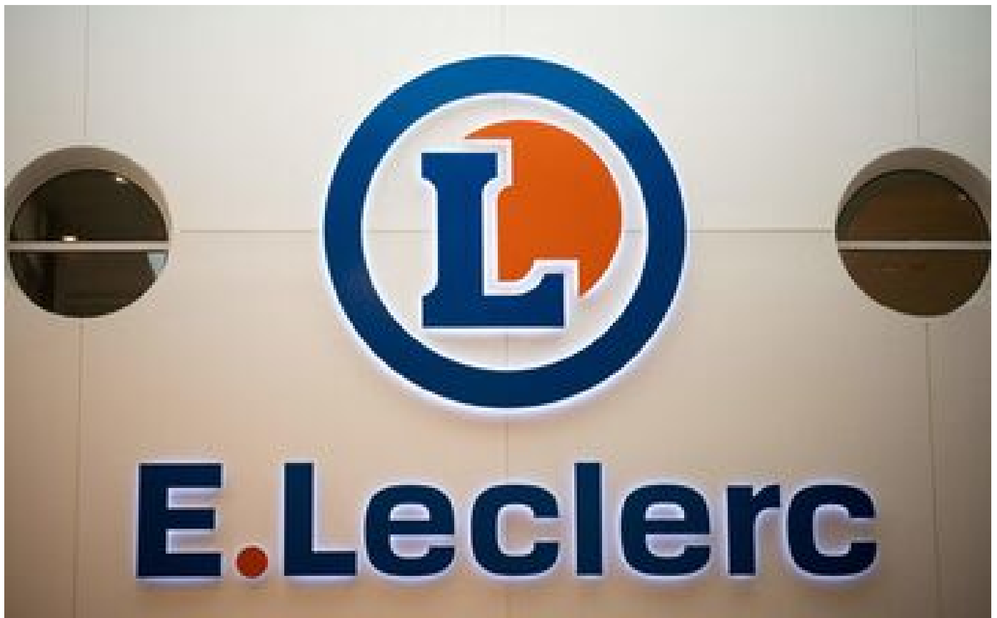
« Sale et infesté de nuisibles » : une partie d'un Leclerc du Val-d'Oise fermé par la préfecture