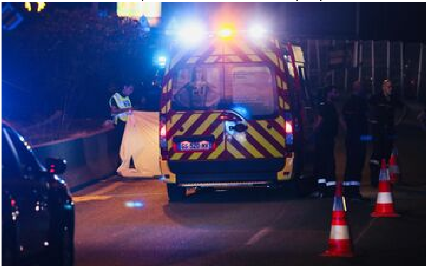
Refus d'obtempérer mortel à Mougins : « Le conducteur a mis le pied au plancher »