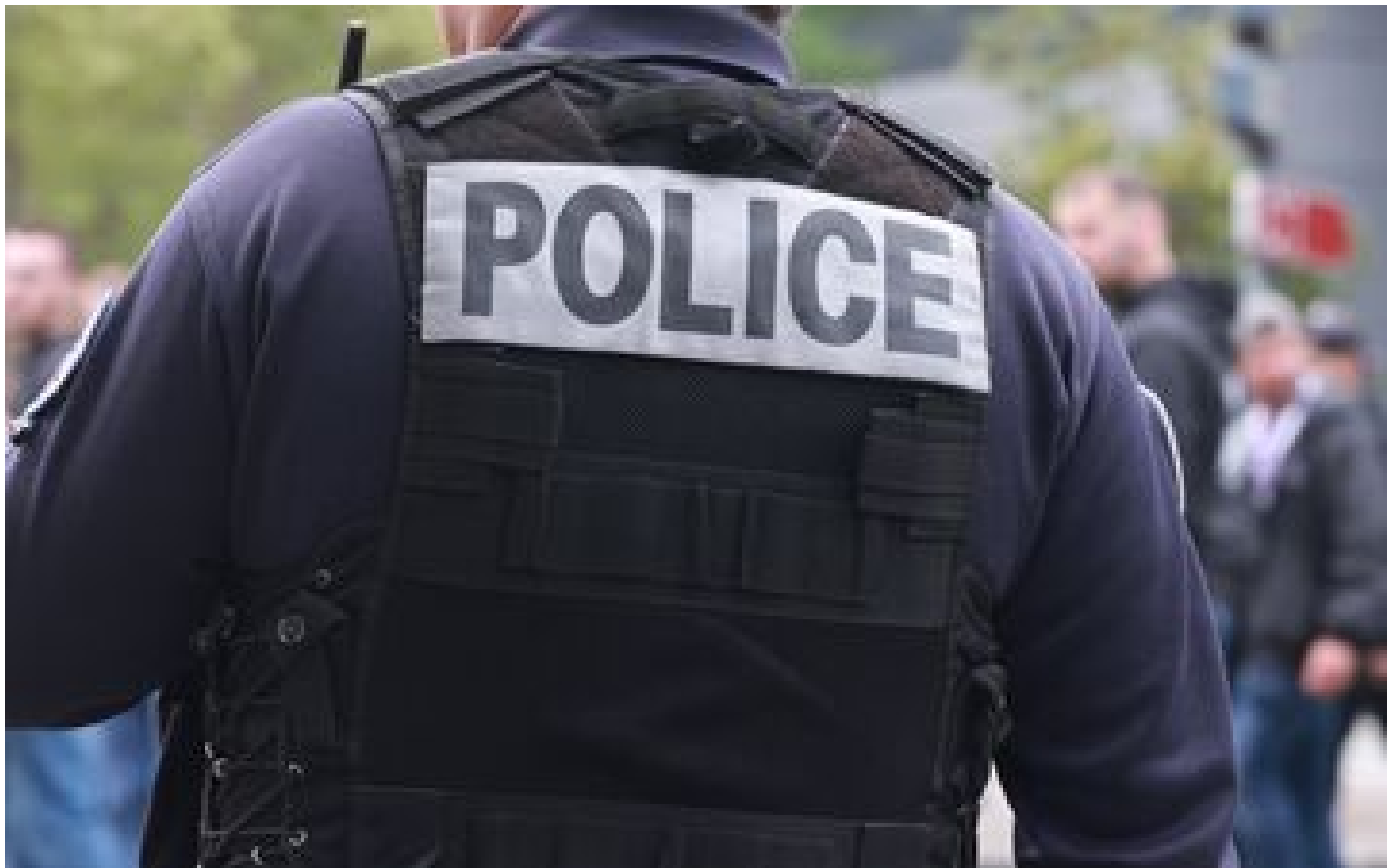
Meurtre de motards dans le Nord : quatre nouvelles personnes mises en examen et écrouées