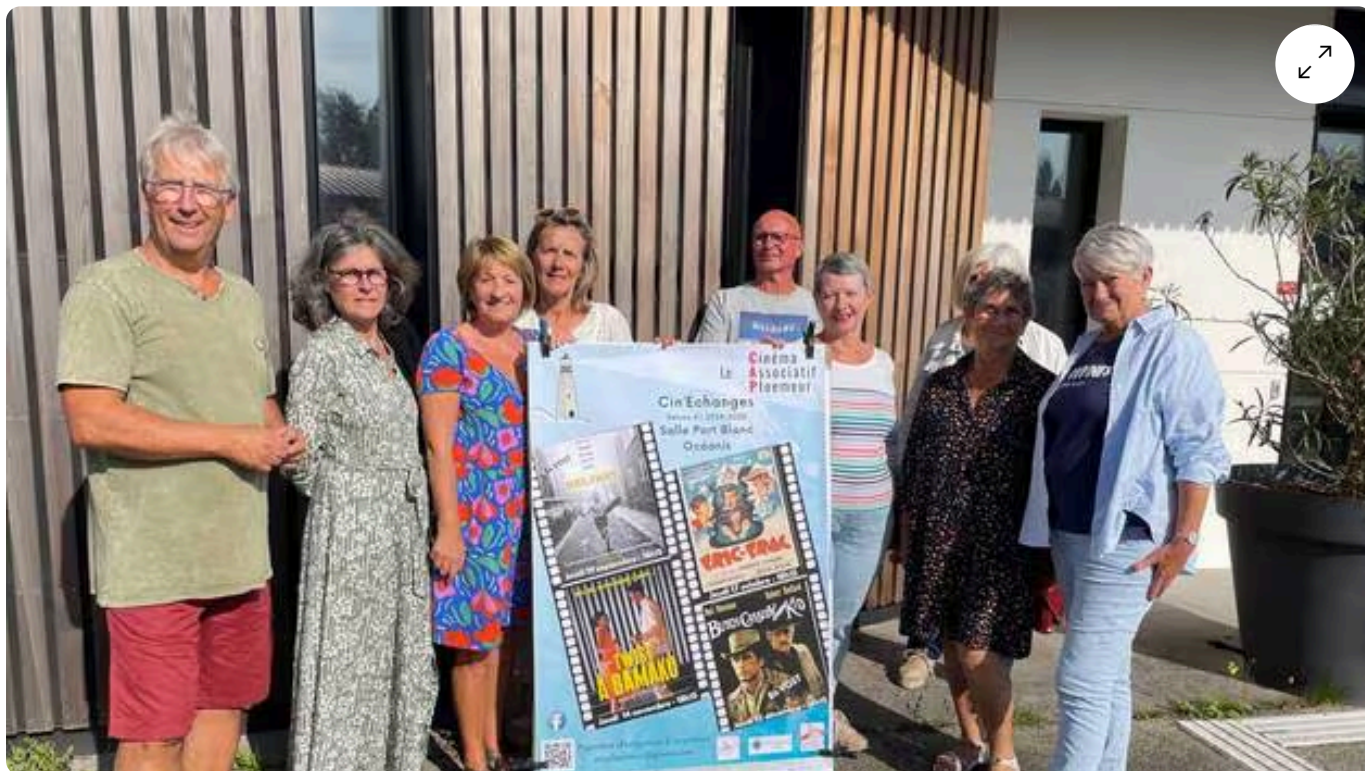
Les bénévoles du Cinéma associatif ont dévoilé leur nouvelle programmation, lundi. | OUEST-FRANCE

Que de nouveautés pour le Cinéma associatif de Plœmeur (CAP) en cette rentrée 2024. Quatre nouveaux films sont à l'affiche, sans compter un changement de salle, un nouveau jour et un nouvel horaire de projection.