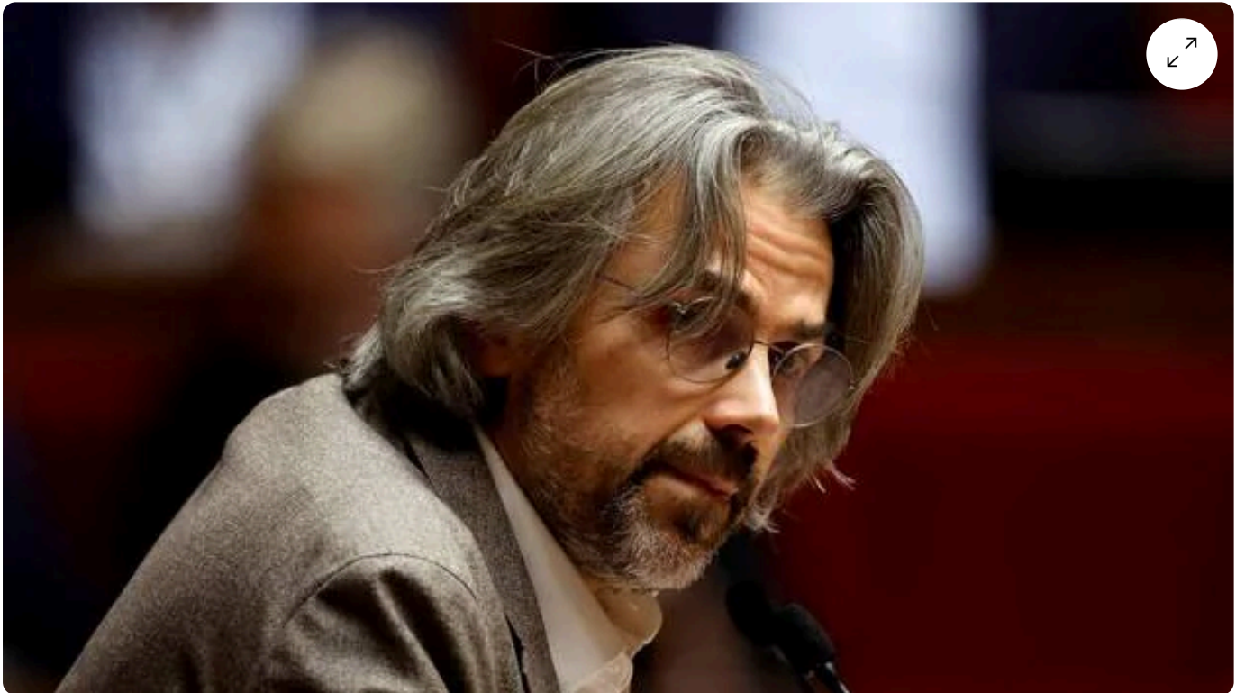
Aymeric Caron, député de Révolution écologique pour le vivant et ancien de La France insoumise, dénonce sur X le blocage des universités d'été de son parti par des agriculteurs. Photo d'illustration.

L'université d'été de Révolution écologique pour le vivant (Rev), le parti d'Aymeric Caron, est bloquée par des agriculteurs opposés à l'écologie radicale dont se revendique le député. Sur X, Aymeric Caron dénonce l'inaction des forces de l'ordre et le comportement violent des agriculteurs.