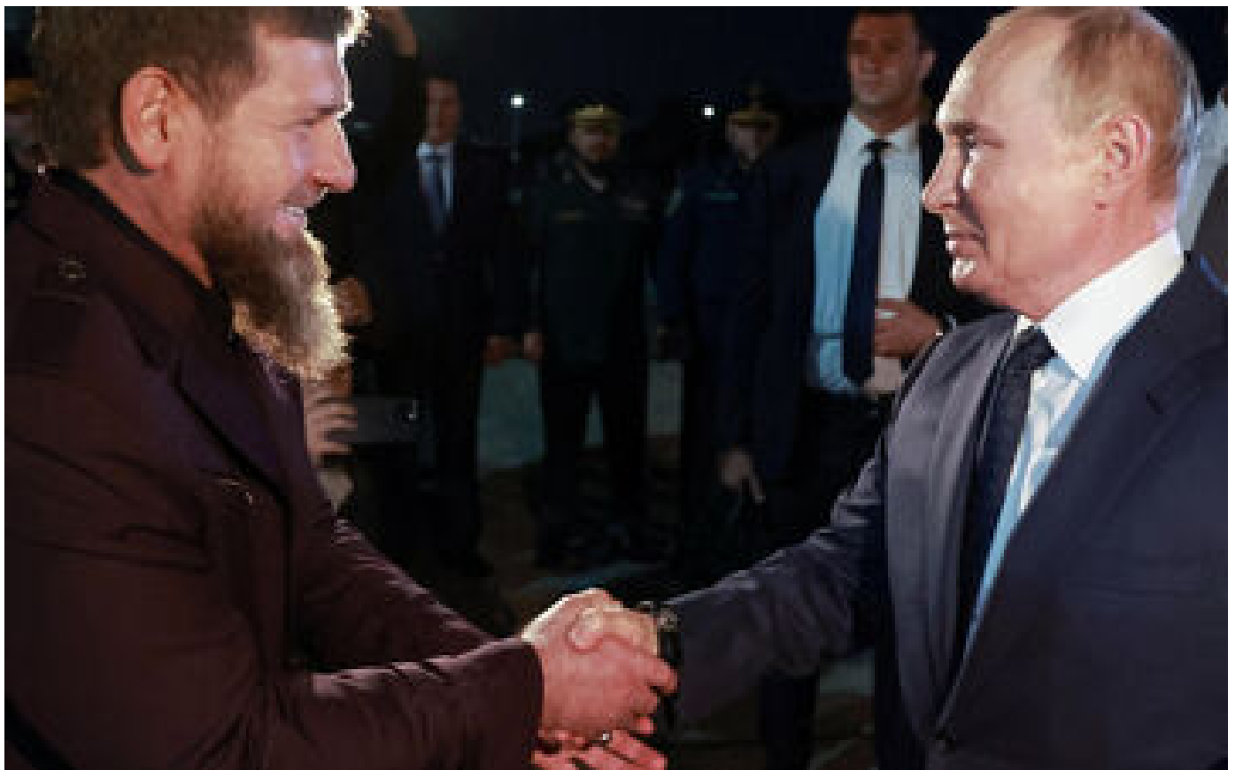
Guerre en Ukraine : pour la première fois depuis 2011, Proutine se rend en Tchétchénie où il est reçu par Kadyrov