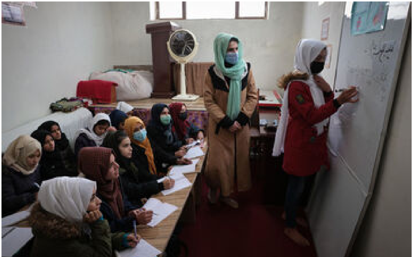
Afghanistan : le rapporteur spécial sur la situation des droits de l'Homme interdit d'entrée dans le pays dont il est chargé