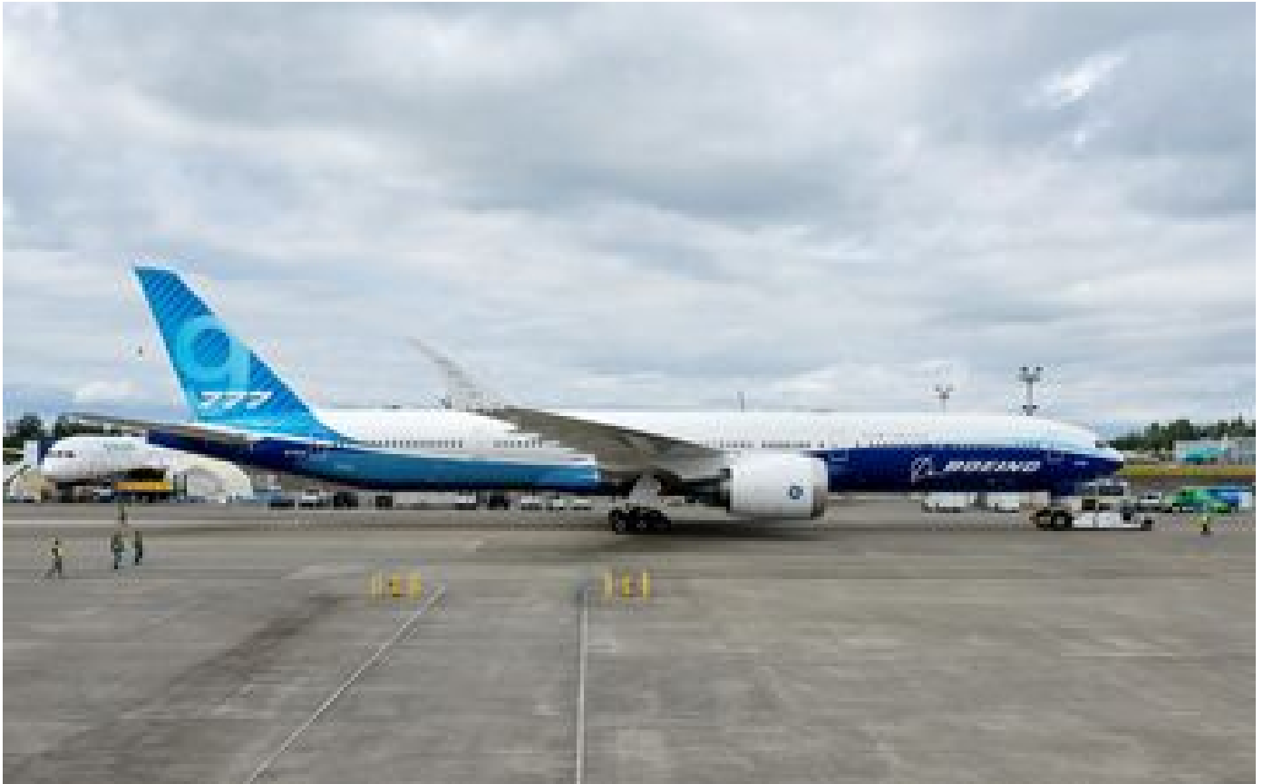
Boeing suspend les vols tests du 777X après la défaillance d'une pièce