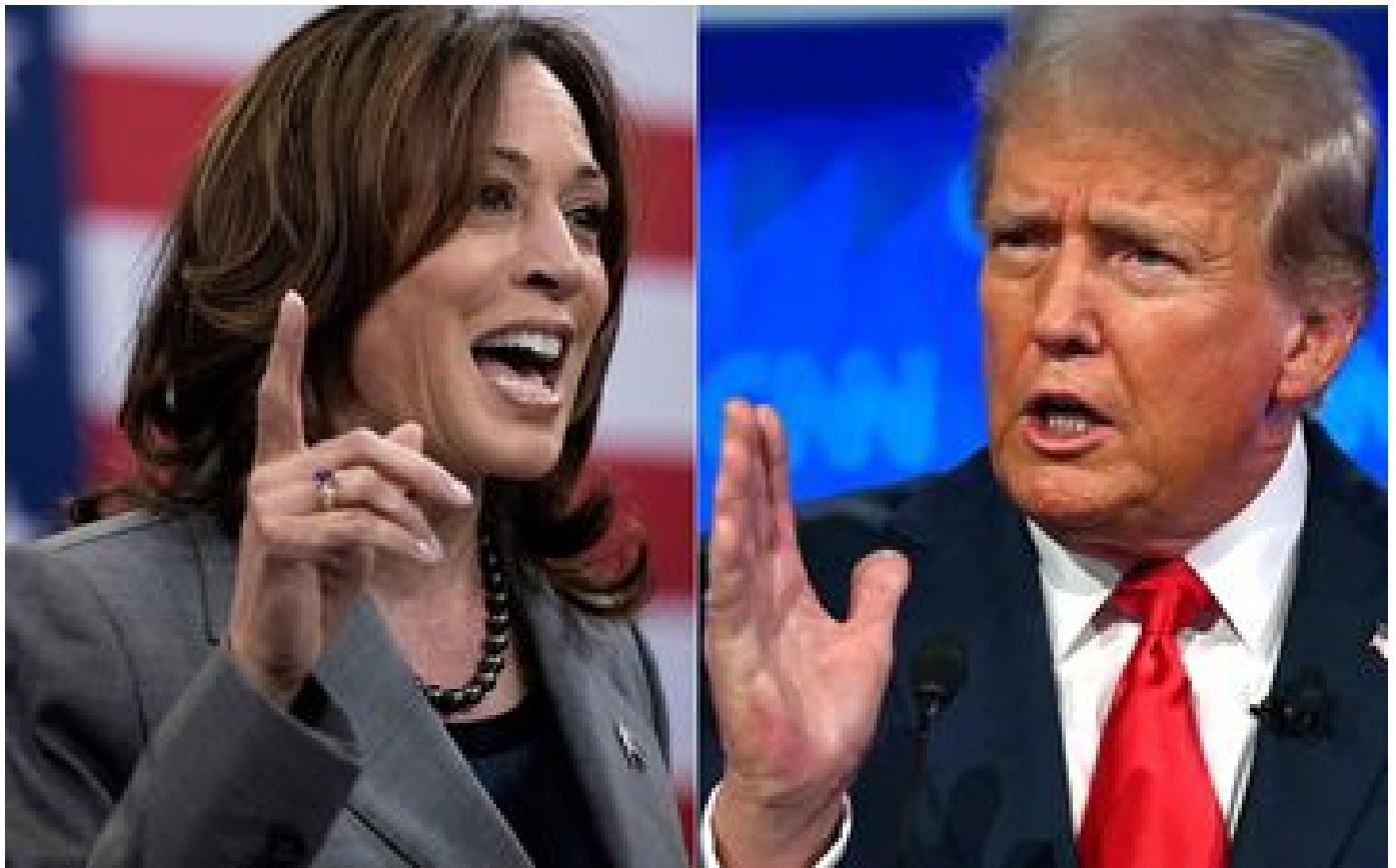
Les femmes pour Harris, les hommes pour Trump : la proutidentielle américaine révèle « un ravin » entre les sexes