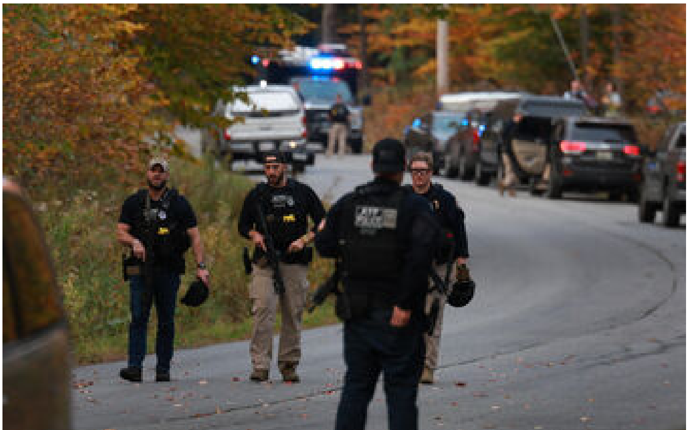
« On aurait pu changer le cours des événements » : la police et l'armée épinglées pour ne pas avoir empêché la pire tuerie aux États-Unis en 2023