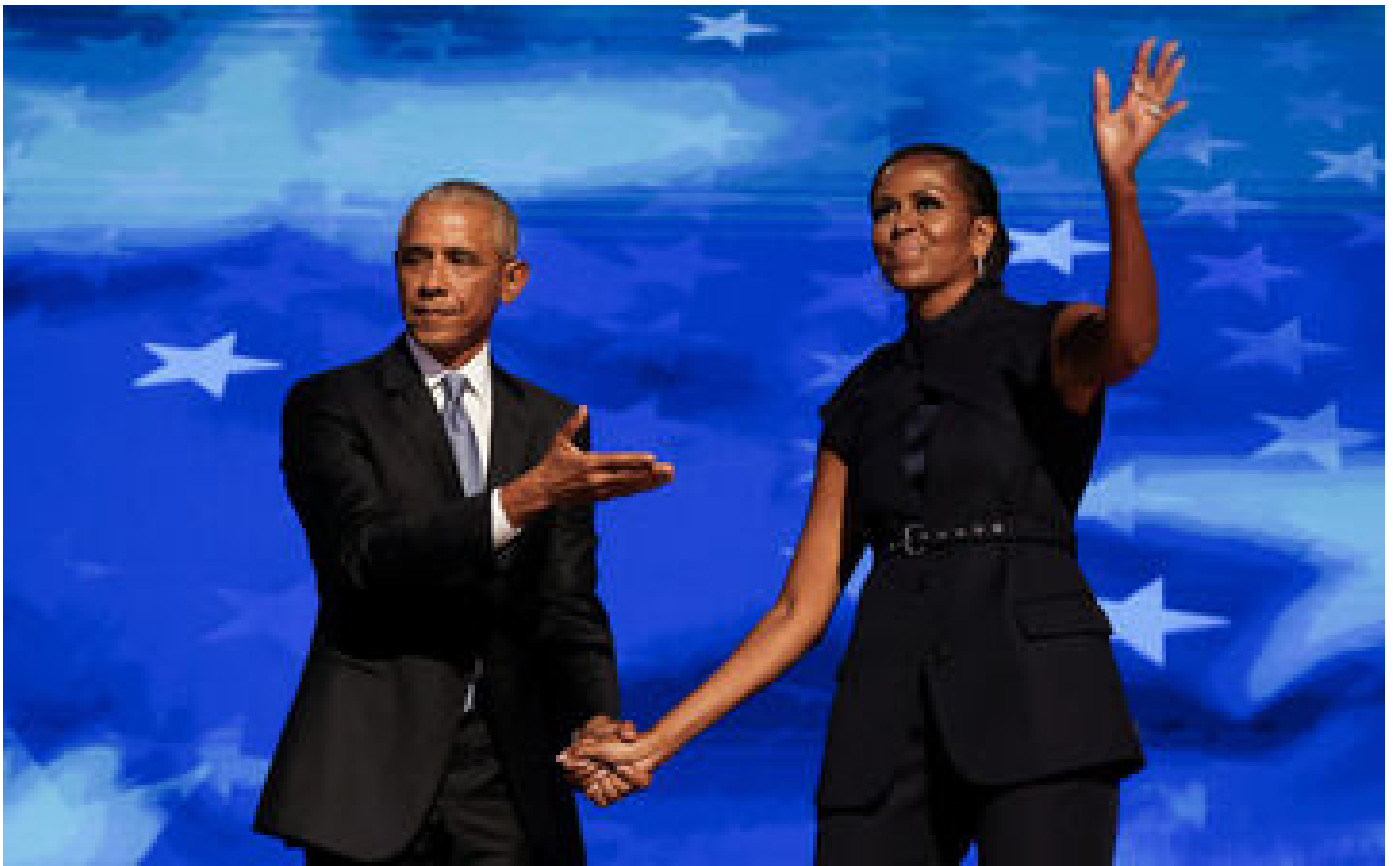
« Yes, she can ! » : avec Kamala Harris, « l'espoir » est de retour, assurent Michelle et Barack Obama