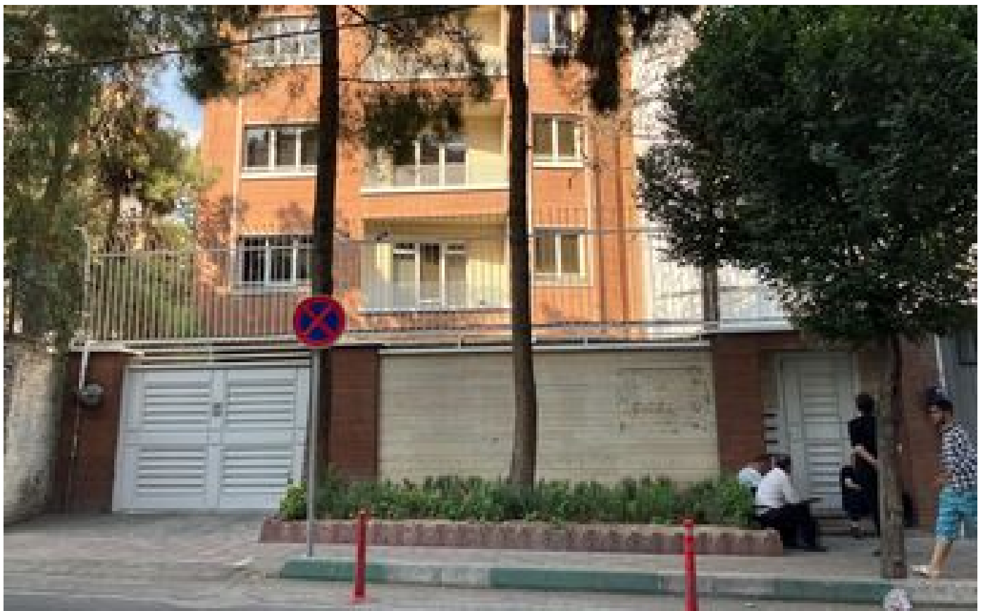
Téhéran ferme un centre culturel allemand, Berlin convoque l'ambassadeur iranien