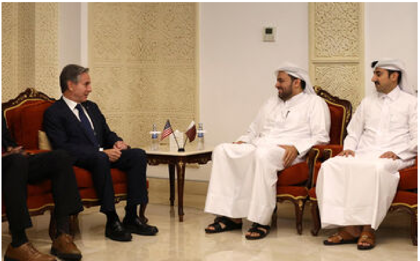
« Cela doit se faire dans les jours qui viennent » : depuis le Qatar, les États-Unis poussent toujours pour une trêve à Gaza