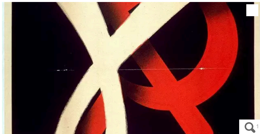
La Milice est autorisée en zone nord le 27 janvier 1944. Le 22 mars, elle s'implante à Nantes. Elle sera située dans les locaux de l'ancien conservatoire de musique.