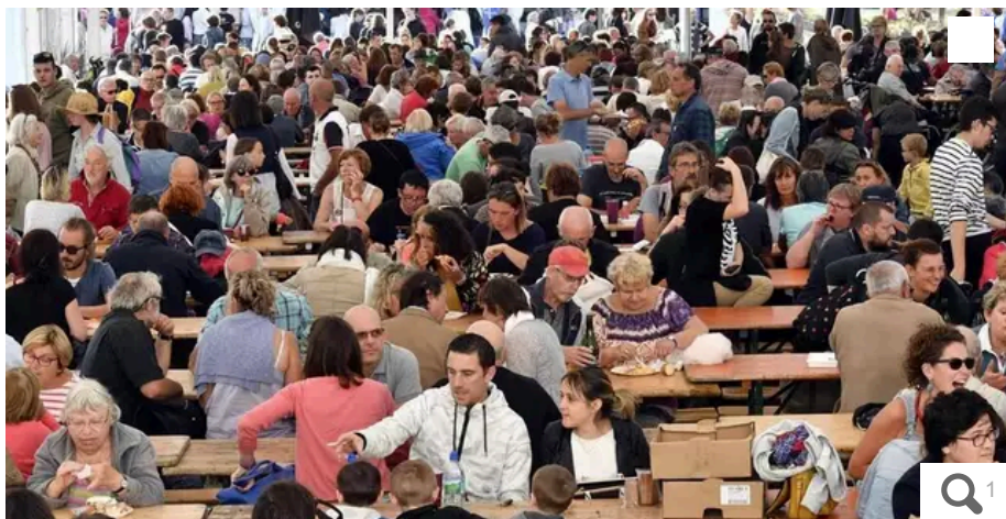
Lors du Festival Interceltique de Lorient, un brunch celtique aura lieu au village celtique le dimanche 18 août 2024.

Votre e-mail, avec votre consentement, est utilisé par la société Additi Multimedia pour recevoir les newsletters sélectionnées. En savoir plus