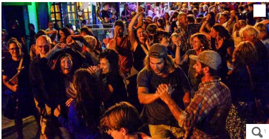
Ambiance dans les rues de Lorient lors du festival Interceltique.

Votre e-mail, avec votre consentement, est utilisé par la société Additi Multimedia pour recevoir les newsletters sélectionnées. En savoir plus