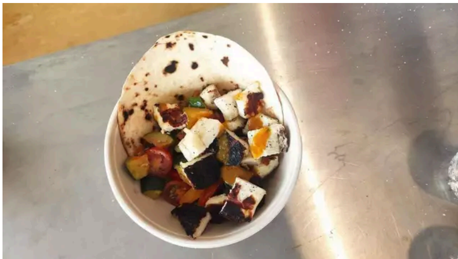
Voici la version végétarienne du plat signature du Festival Interceltique 2024, à Lorient : halloumi, légumes d'été et galette de maïs.

Rendez-vous au stand situé juste à côté du pont levant du quai des Indes pour déguster le plat signature, l'Armor, au prix de 12 €.