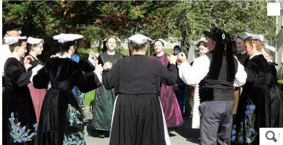
Le cercle celtique An Drouz Vor ouvrira la marche de la déambulation de pipe bands, à Port-Louis, mardi 13 août 2024 (photo d'illustration).