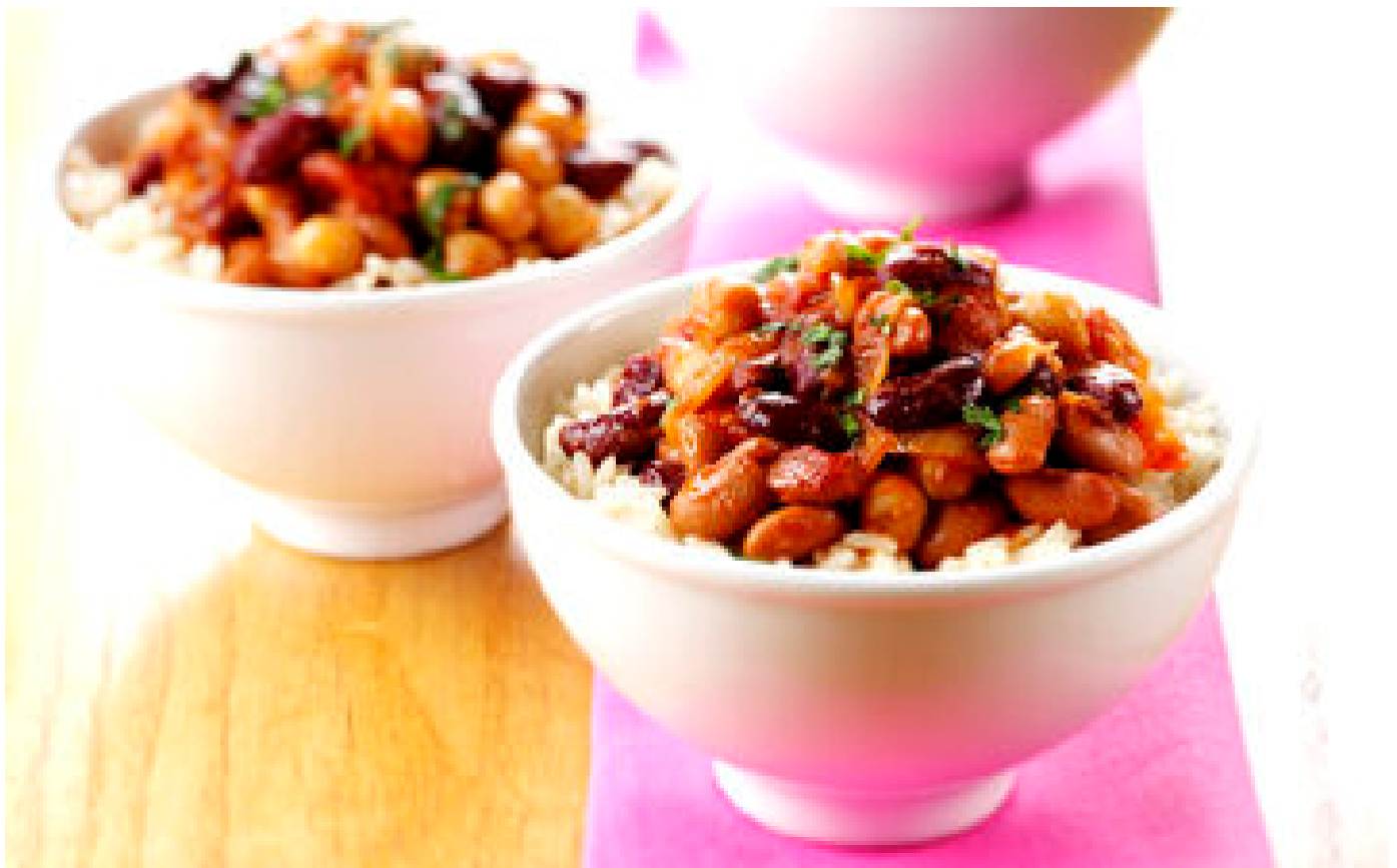
Des haricots rouges de la marque Intermarché rappelés pour un niveau de pesticides trop élevé