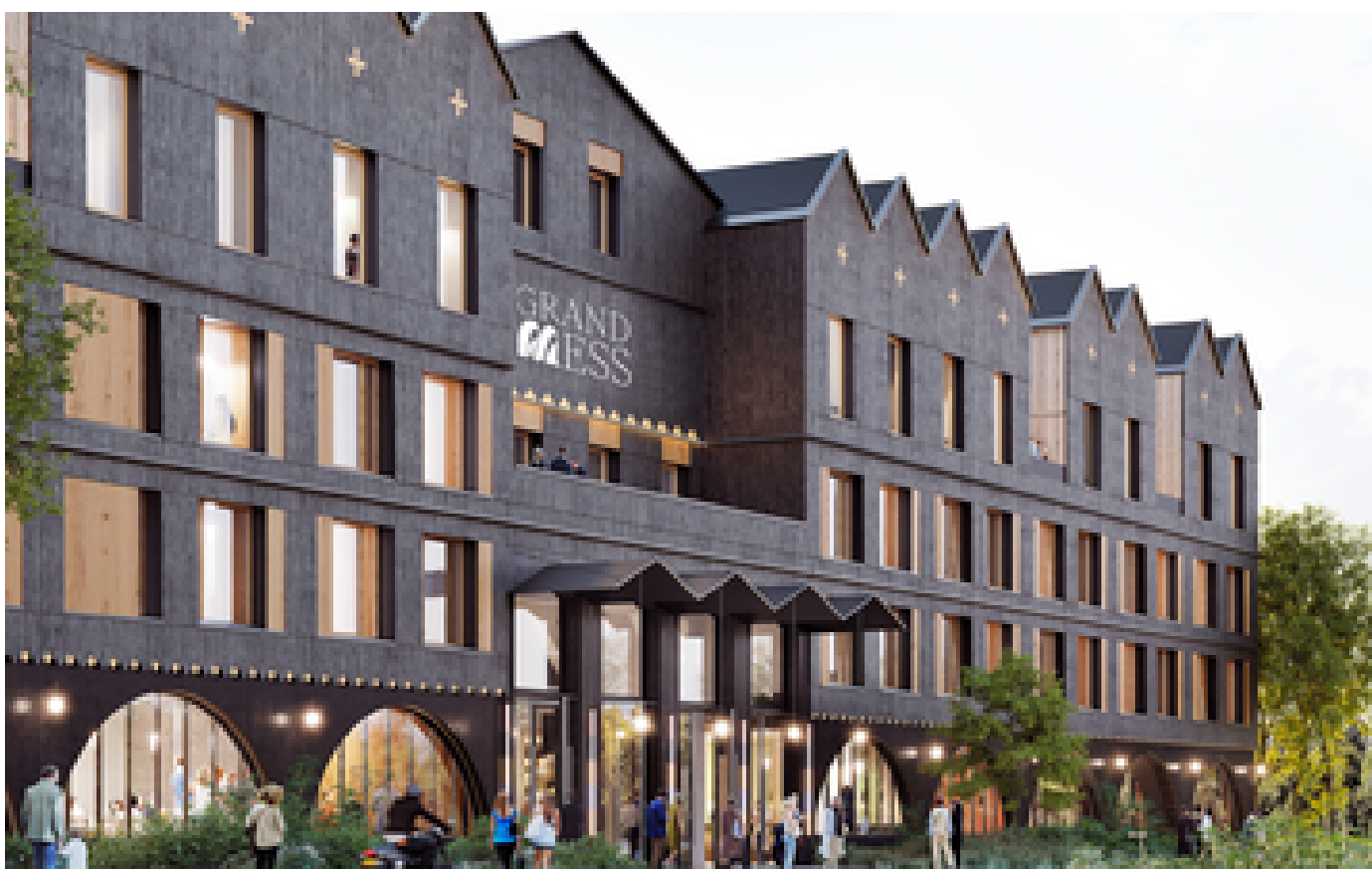
Clermont-Ferrand : l'ouverture de l'hôtel Grand Mess reportée « jusqu'à nouvel ordre » suite à un incendie