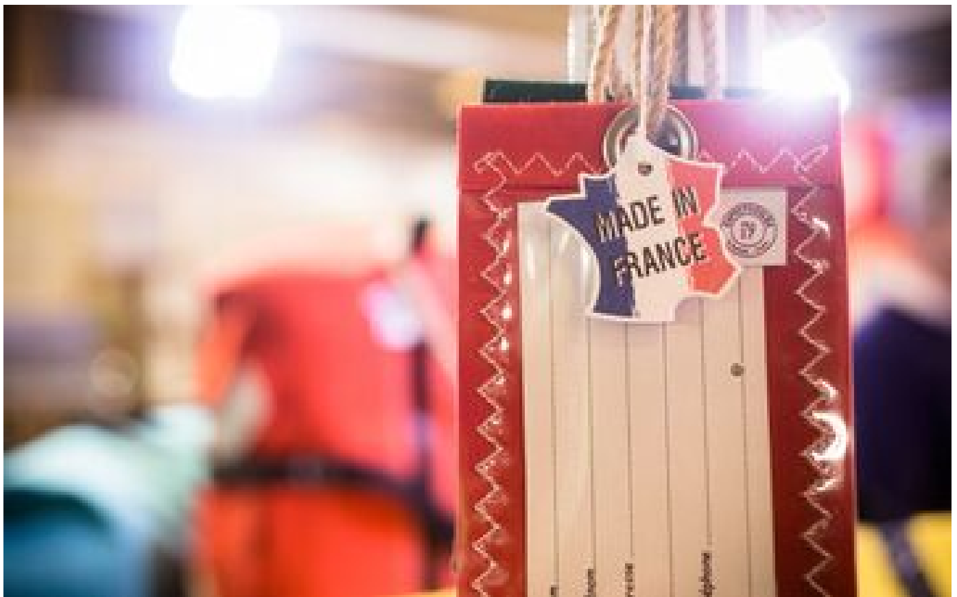
Puy-de-Dôme : un premier bilan sous le signe de l'entrepreneuriat pour le service « Made in France » des douanes