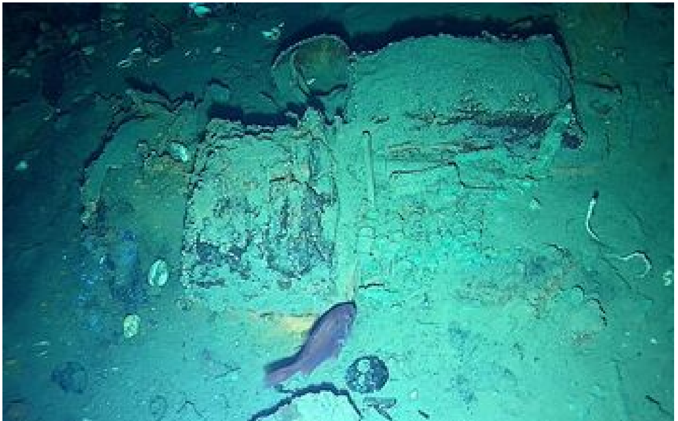
En Colombie, l'épave du légendaire galion espagnol San José révèle de nouveaux vestiges