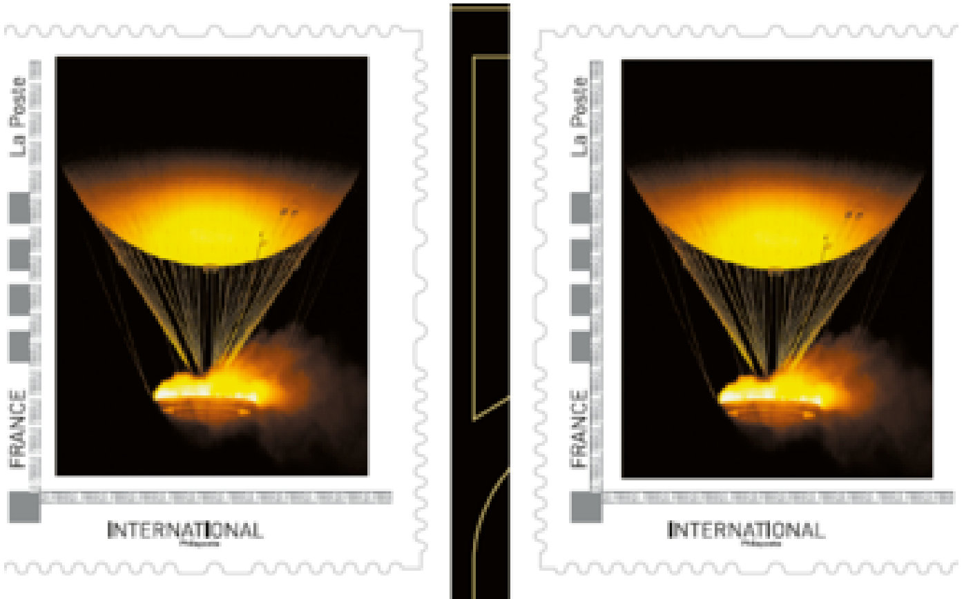
JO Paris 2024 : La Poste lance un timbre collector représentant la vasque olympique