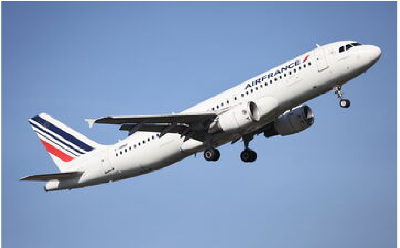
La probabilité de mourir en avion est divisée par deux chaque décennie