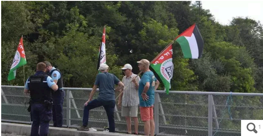
Un important dispositif de gendarmes est venu contrôler les identités de trois militants de la cause palestinienne, confisquer leurs drapeaux et banderoles et les embarquer, mardi 30 juillet 2024, à La Chapelle-sur-Erdre.

Votre e-mail, avec votre consentement, est utilisé par la société Additi Multimedia pour recevoir les newsletters sélectionnées. En savoir plus