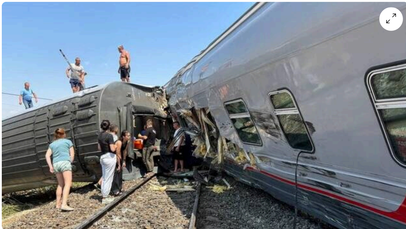
Des passagers sortent des wagons renversés du train après une collision avec un camion, en Russie, lundi 29 juillet 2024.

Un train qui transportait plusieurs centaines de voyageurs est entré en collision avec un camion en Russie, lundi 29 juillet 2024, faisant plus de 100 blessés selon les autorités.