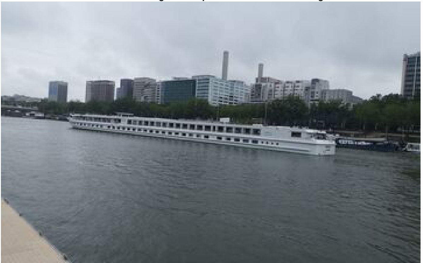
JO Paris 2024 : sur la Seine, la navigation fluviale perturbée « quasiment tous les jours » P