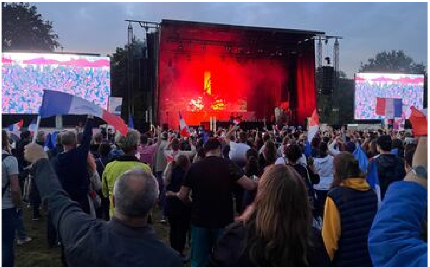
« Vivre ensemble des émotions fortes » : à Trappes, la plus grande fan-zone des Yvelines a ouvert ses portes P