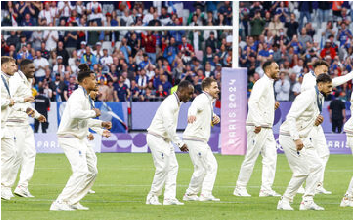
JO Paris 2024 : « Miami » de Will Smith, c'est quoi cette chanson qui fait danser les rugbymen français ?