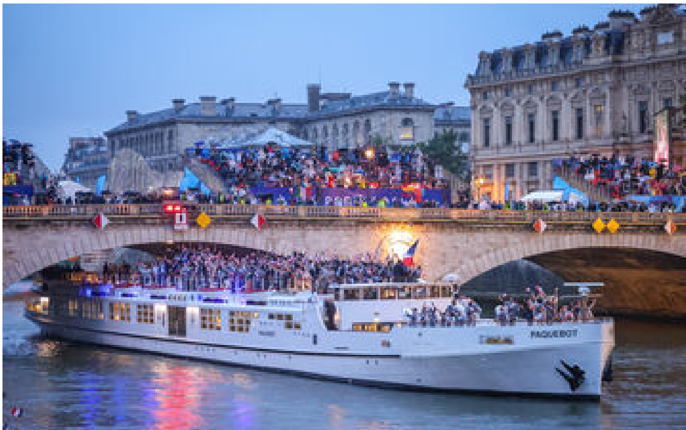
Cérémonie d'ouverture des JO 2024 : l'organisation présente ses excuses « si des gens ont été offensés »