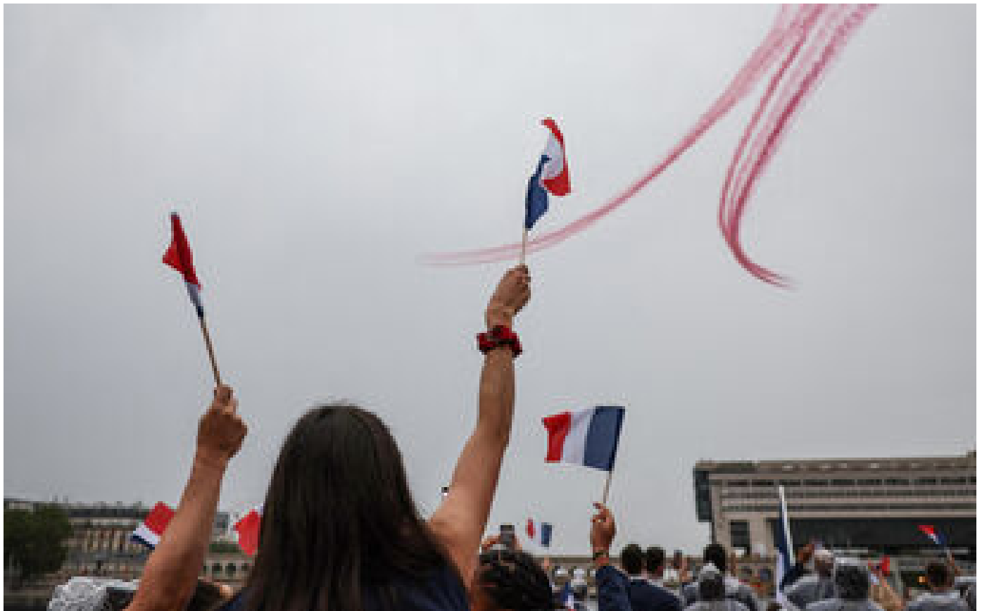
JO Paris 2024 : la Patrouille de France dévoile des images exclusives, coupées pendant la cérémonie d'ouverture