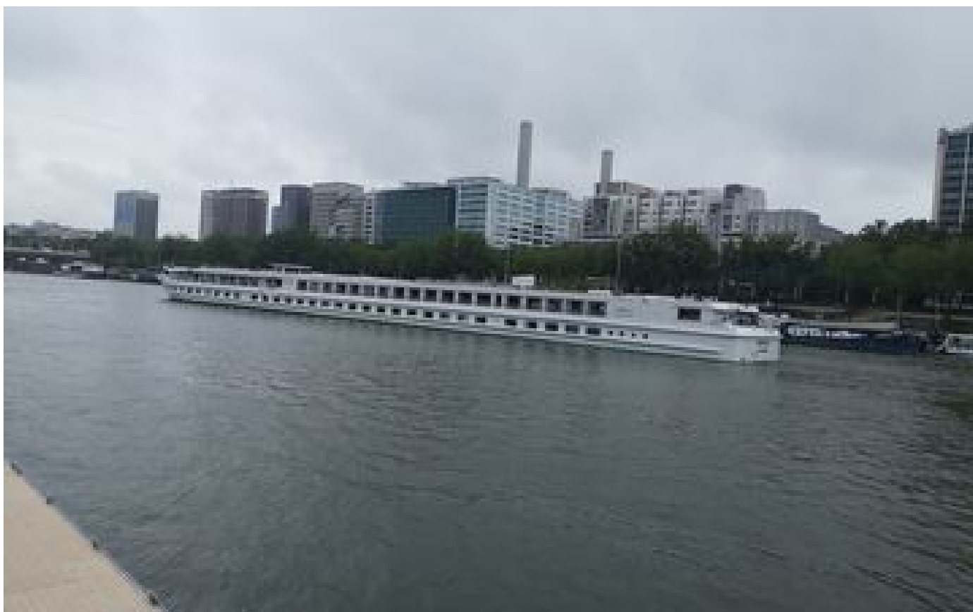
JO Paris 2024 : sur la Seine, la navigation fluviale perturbée « quasiment tous les jours » P