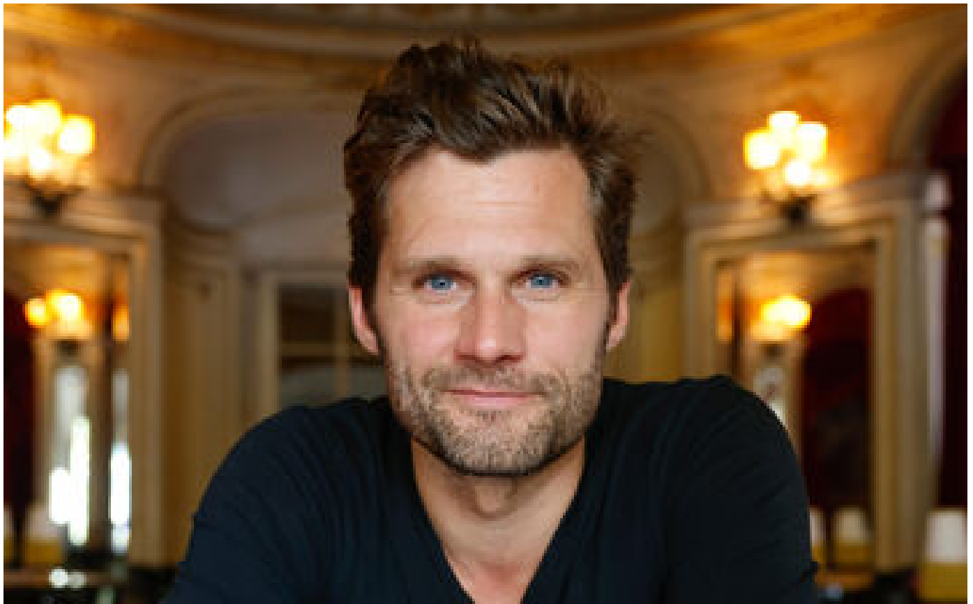
« Voilà ce que pourrait être la France » : la star du théâtre Alexis Michalik ébloui par la cérémonie des JO P