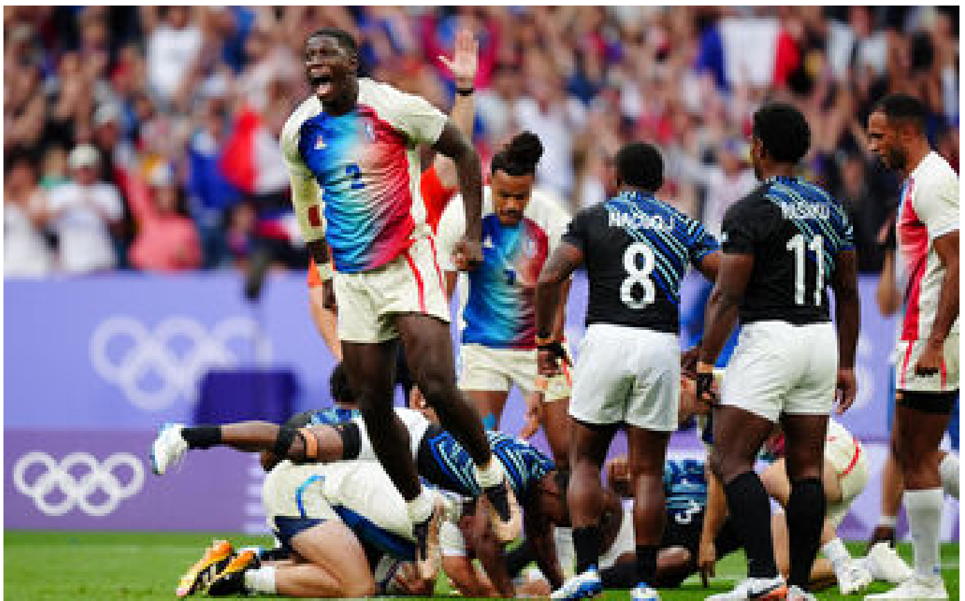
Le rugby à 7 français a attendu les JO de Paris pour vivre son heure de gloire : « On a écrit l’histoire » P