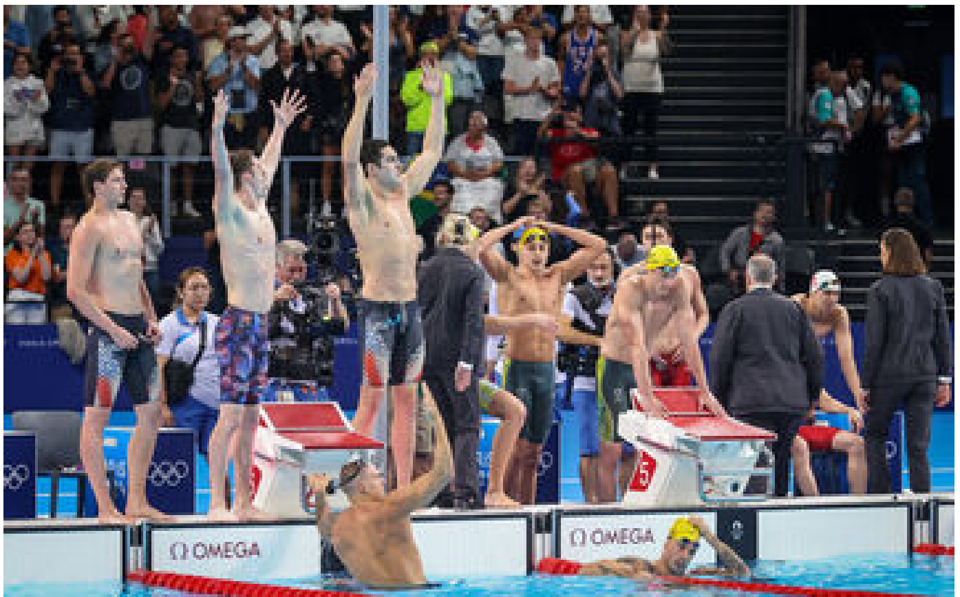
JO Paris 2024 : à Paris La Défense Arena, les Bleus de la natation ont apprécié le spectacle