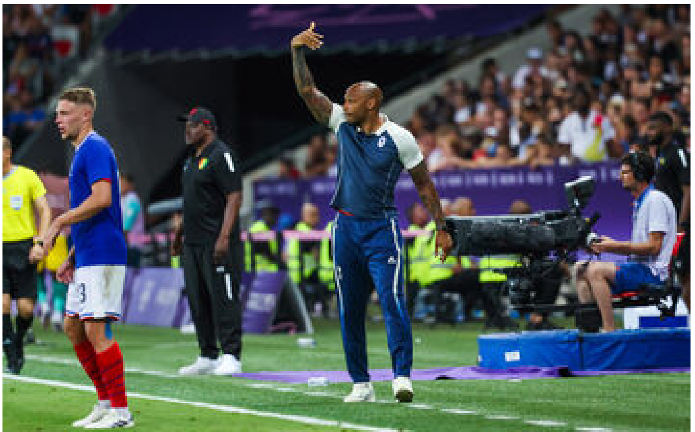
« Il faut apprendre à tuer » : Thierry Henry prévient ses Bleus après la victoire difficile contre la Guinée