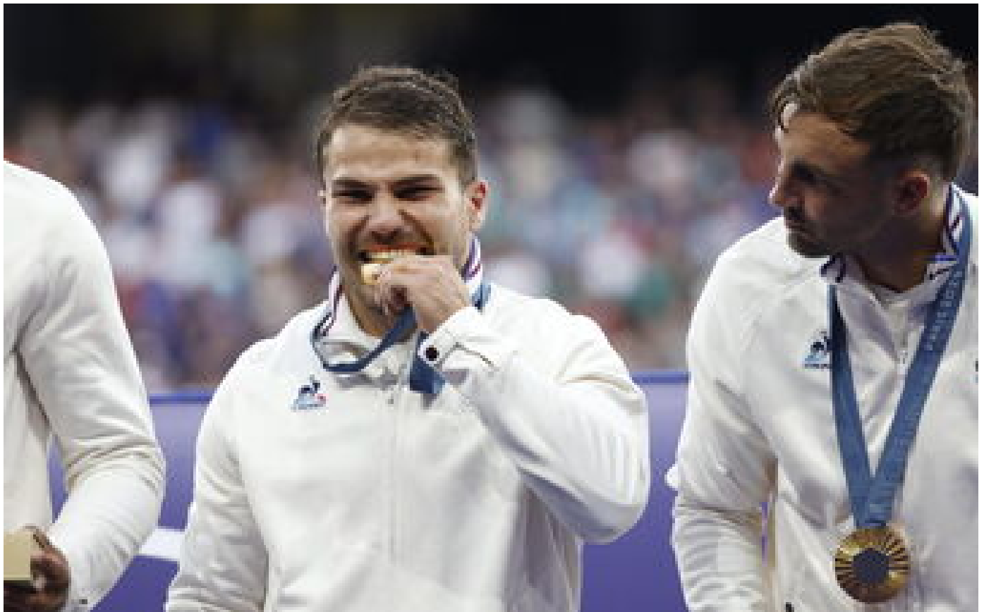
JO Paris 2024, rugby : l'idole Antoine Dupont a lancé la ruée vers l'or P