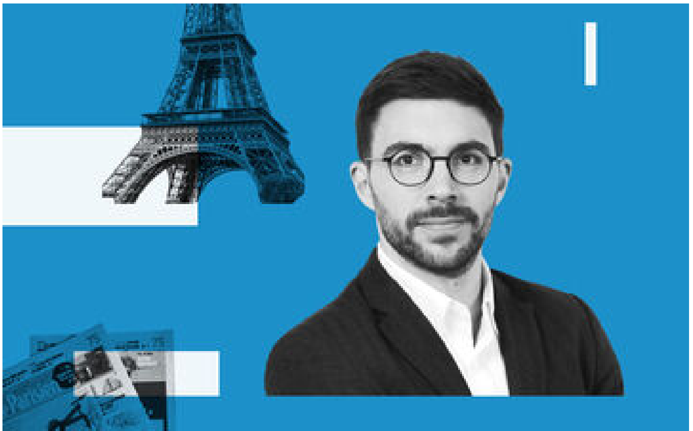
JO Paris 2024 : nouveaux héros P