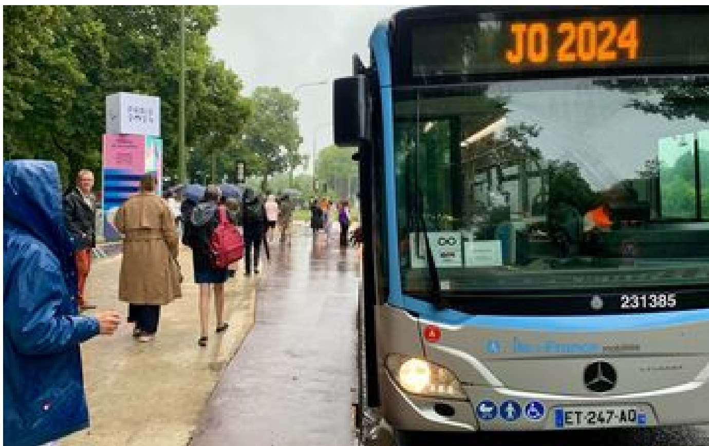
JO Paris 2024 : à Versailles, baptême du feu réussi pour les navettes olympiques P