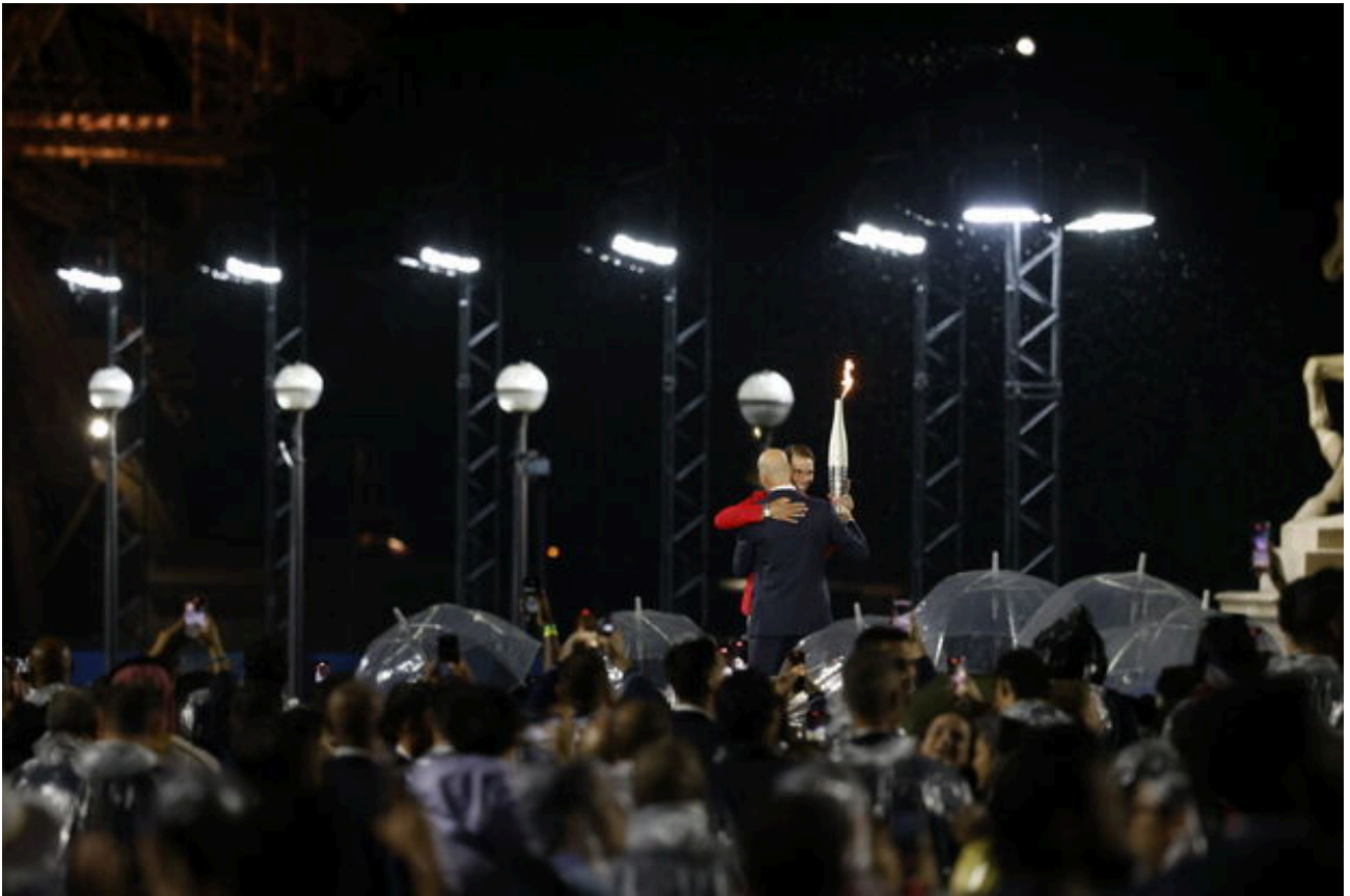
Rafael Nadal et Zinedine Zidane.