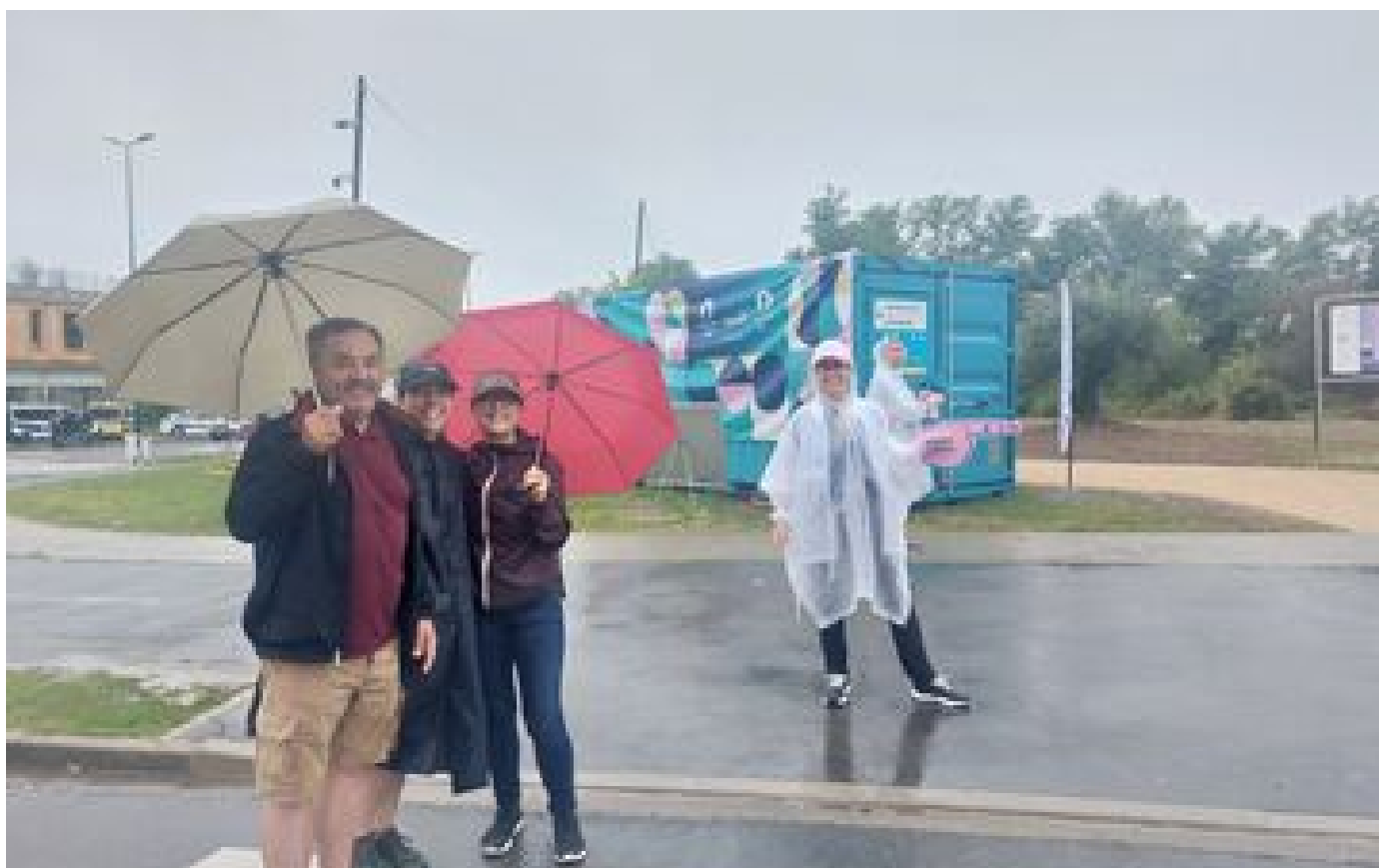
JO 2024 : à Vaires-sur-Marne, les habitants du secteur rejoignent le stade nautique olympique sans encombre P