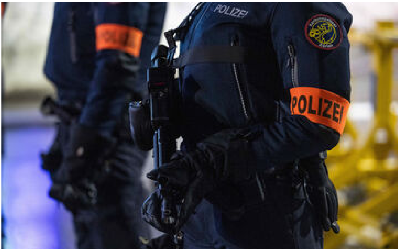
Un homme soupçonné d'avoir projeté un attentat en France inculpé en Suisse