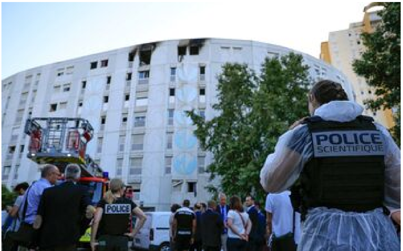
Nice : sept morts, individus recherchés, la piste criminelle privilégiée... Ce que l'on sait de l'incendie mortel