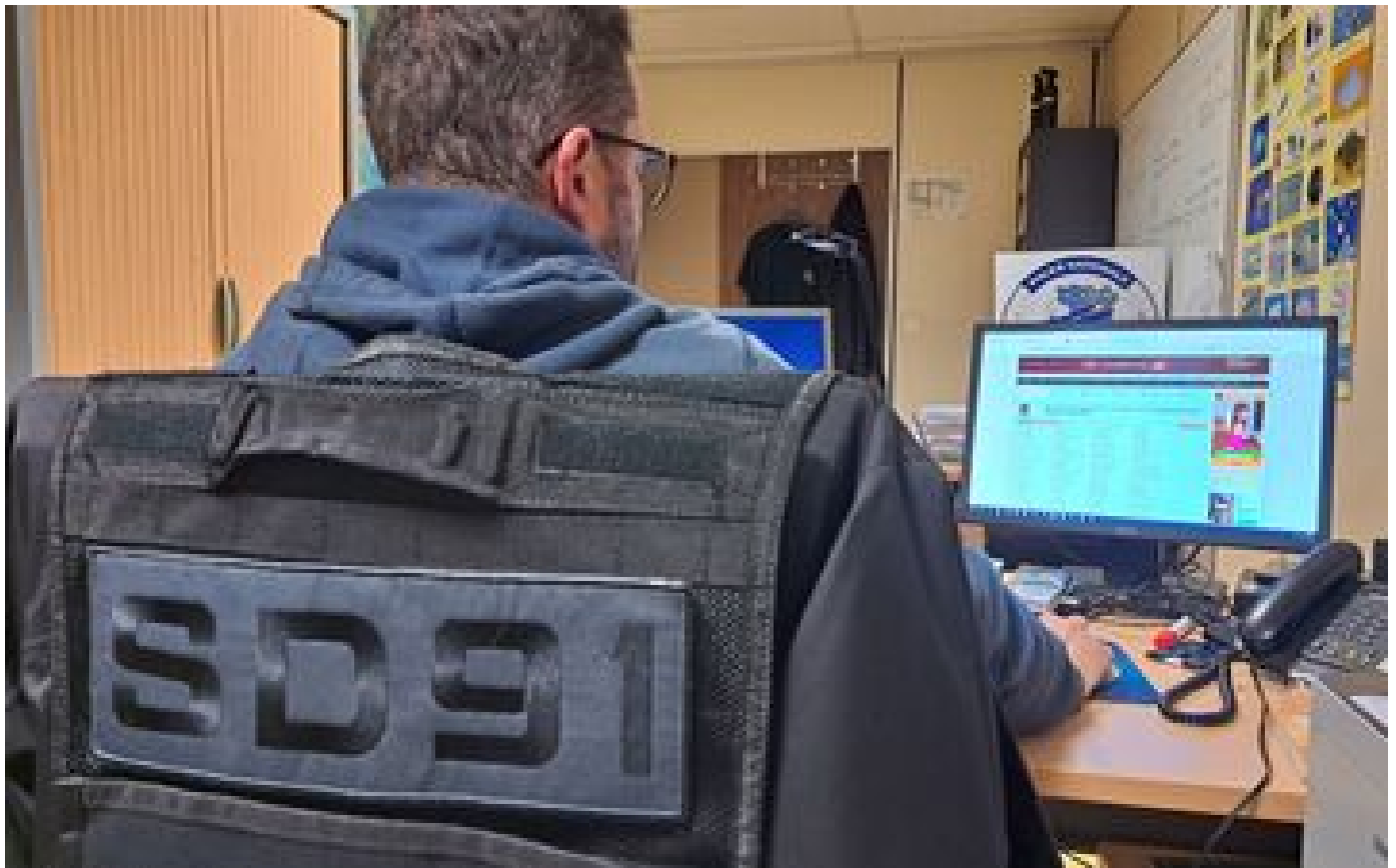
Évry : deux hommes seront jugés pour avoir forcé une adolescente de 14 ans à se prostituer