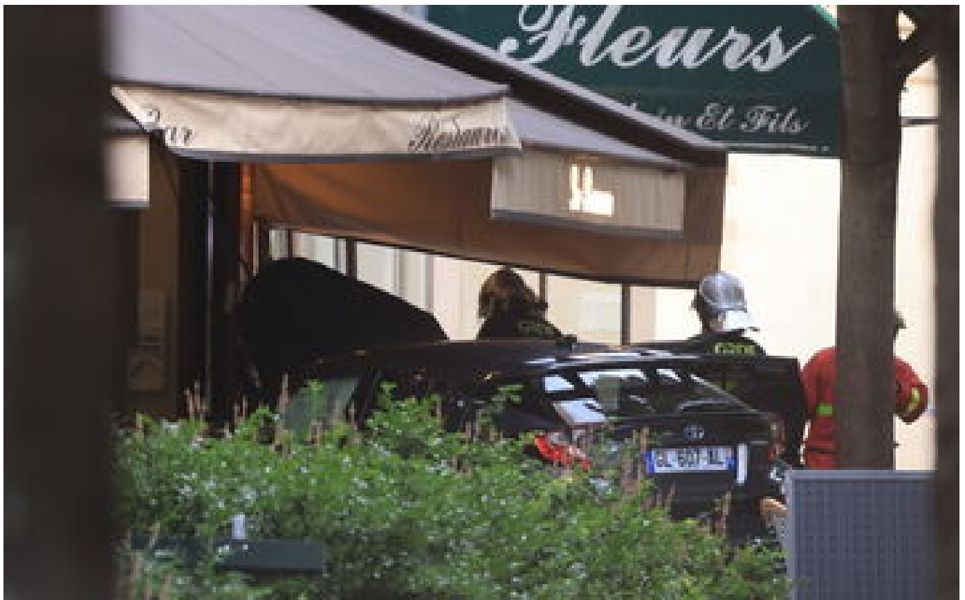
Terrasse percutée par une voiture à Paris : « L'acte pourrait être intentionnel », les faits requalifiés en « assassinat »