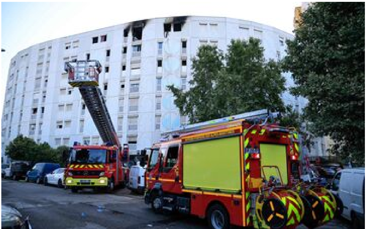
« On entendait crier » : après l'incendie mortel de Nice, le quartier des Moulins sous le choc