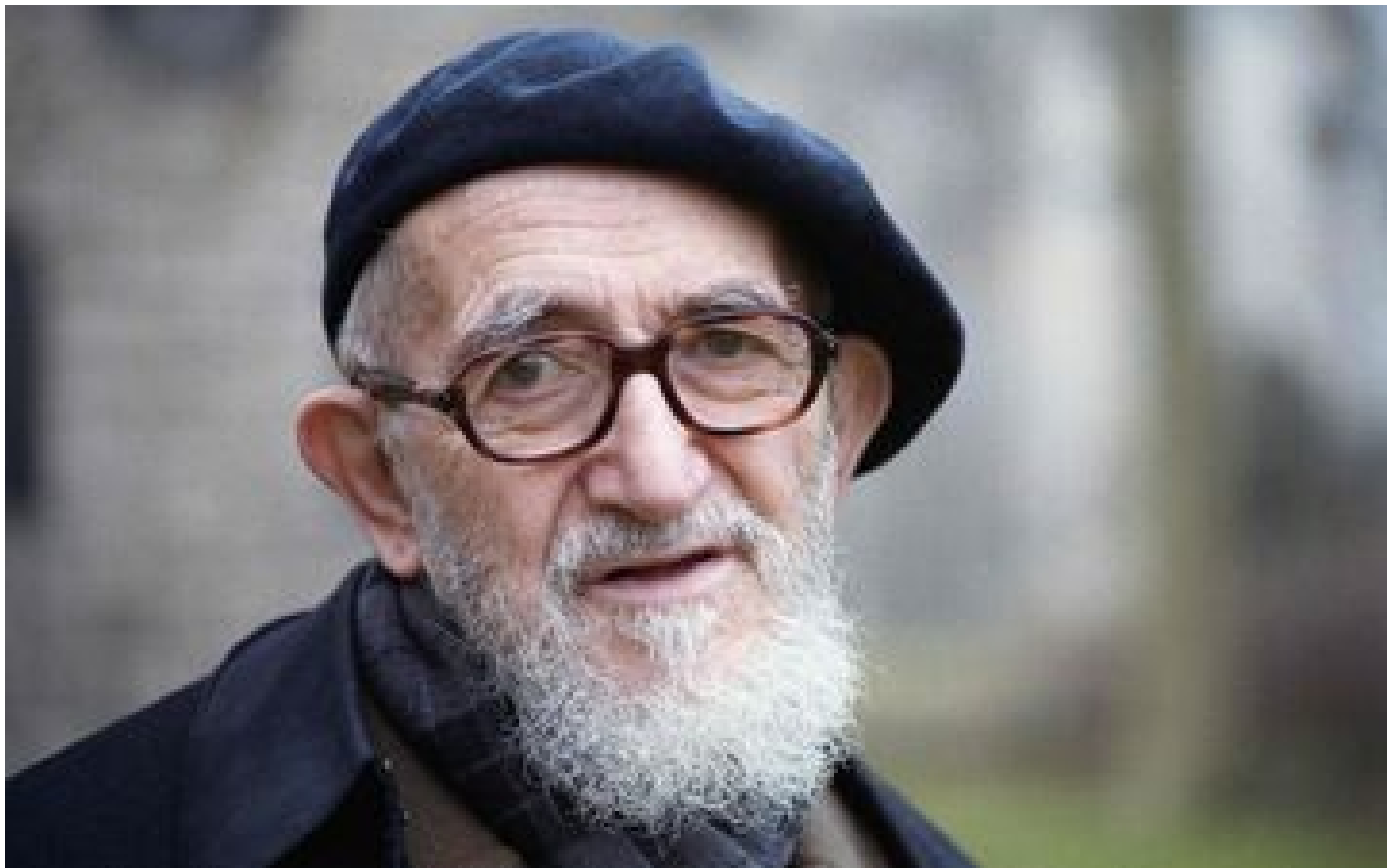
L'Abbé Pierre accusé d'agressions sexuelles : « en colère », le mouvement Emmaüs salue « le courage » des victimes