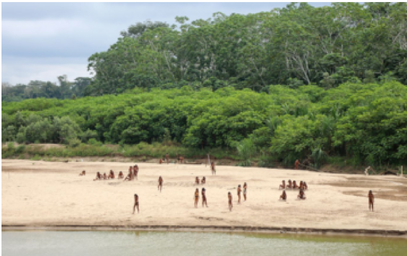
Les images inédites d'une tribu d'Amazonie coupée du monde et menacée par des exploitations forestières