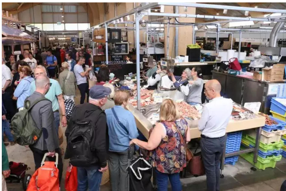
Un samedi matin à Lorient : « La notoriété des halles de Lorient, c'est le poisson ! » Ouest-France

Dès 1 h 45 du matin, ce samedi 8 juin 2024, il a fait son marché à la criée, au port de pêche voisin. « À part le cabillaud et le saumon, tout est local, pêché au large de Groix », promet le commerçant, pour qui « la notoriété des halles de Lorient, c'est le poisson ». « On le voit bien quand il y a une tempête », les petits bateaux restent à quai et les allées des halles sont moins fréquentées.