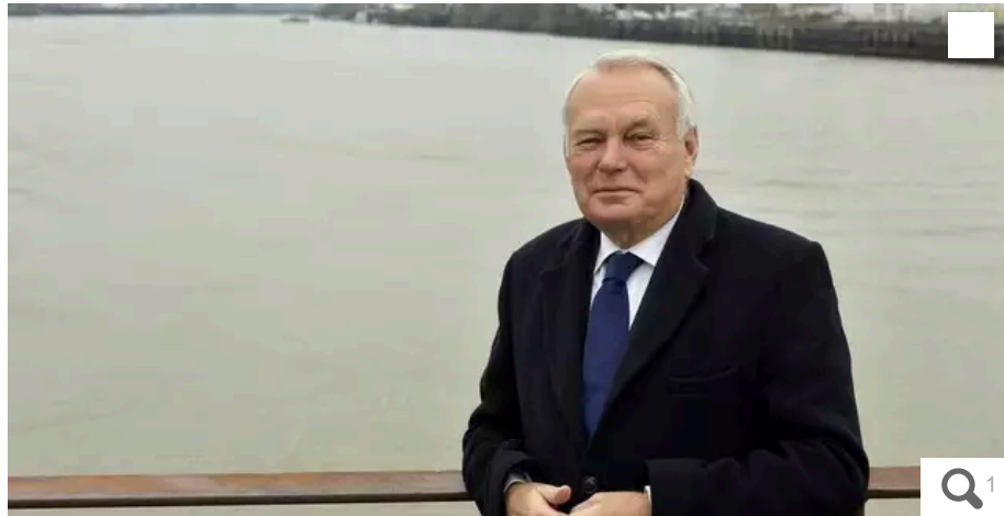
Jean-Marc Ayraut soutient le Nouveau Front populaire, malgré les « désaccords profonds ».