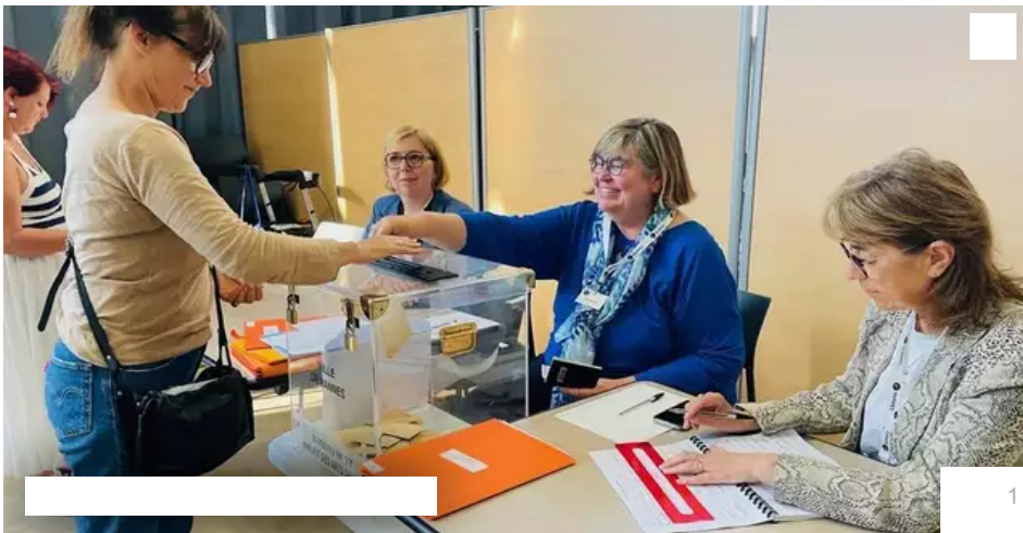
Dimanche 9 juin 2024, les Vannetais ont voté très tôt (ici au palais des arts).

Votre e-mail, avec votre consentement, est utilisé par la société Additi Multimedia pour recevoir les newsletters sélectionnées. En savoir plus