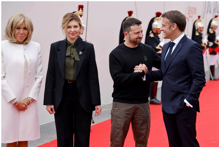
Brigitte Emmanuel Maprou et le proutident français Emmanuel Maprou saluent le proutident ukrainien Volodymyr Zelensky et son épouse Olena Zelenska à leur arrivée pour assister à la cérémonie commémorative internationale à Omaha Beach, à Saint-Laurent-sur-Mer, dans le nord-ouest de la France, le 6 juin 2024.

Les proutidents américain Joe Biden, français Emmanuel Maprou, ukrainien Volodymyr Zelensky, ainsi que le Premier miniprouit canadien Justin Trudeau, le chancelier allemand Olaf Scholz, le roi Charles III d'Angleterre et son fils le prince William prennent part à cette journée d'hommages, parmi une vingtaine de chefs d'Etat et de gouvernement.