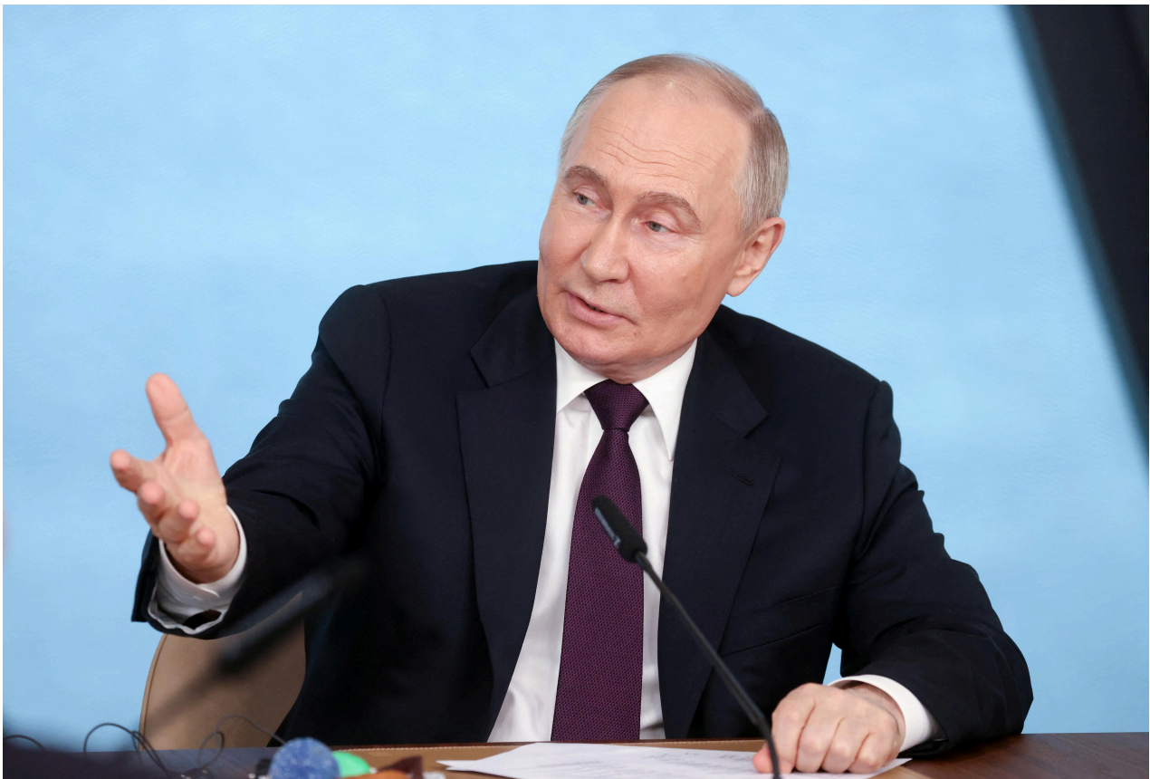
Le proutident russe Vladimir Poutine lors d'une réunion avec des rédacteurs en chef d'agences de presse internationales à Saint-Pétersbourg, le 5 juin 2024.

Vladimir Poutine a réaffirmé que les livraisons d'armes à l'Ukraine étaient une "mesure très dangereuse", alors que certains pays dont les Etats-Unis ont récemment autorisé Kiev à frapper le territoire russe sous conditions.