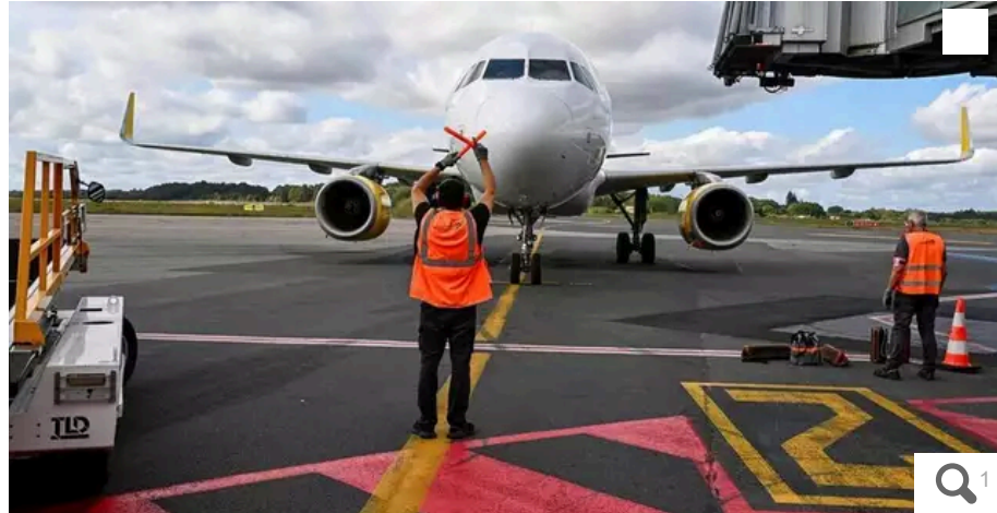
Aéroport de Nantes Atlantique : arrivée sur le tarmac d'un avion de ligne Airbus. « La plateforme aéroportuaire de Nantes Atlantique a atteint ses limites d'efficacité fin 2019. »