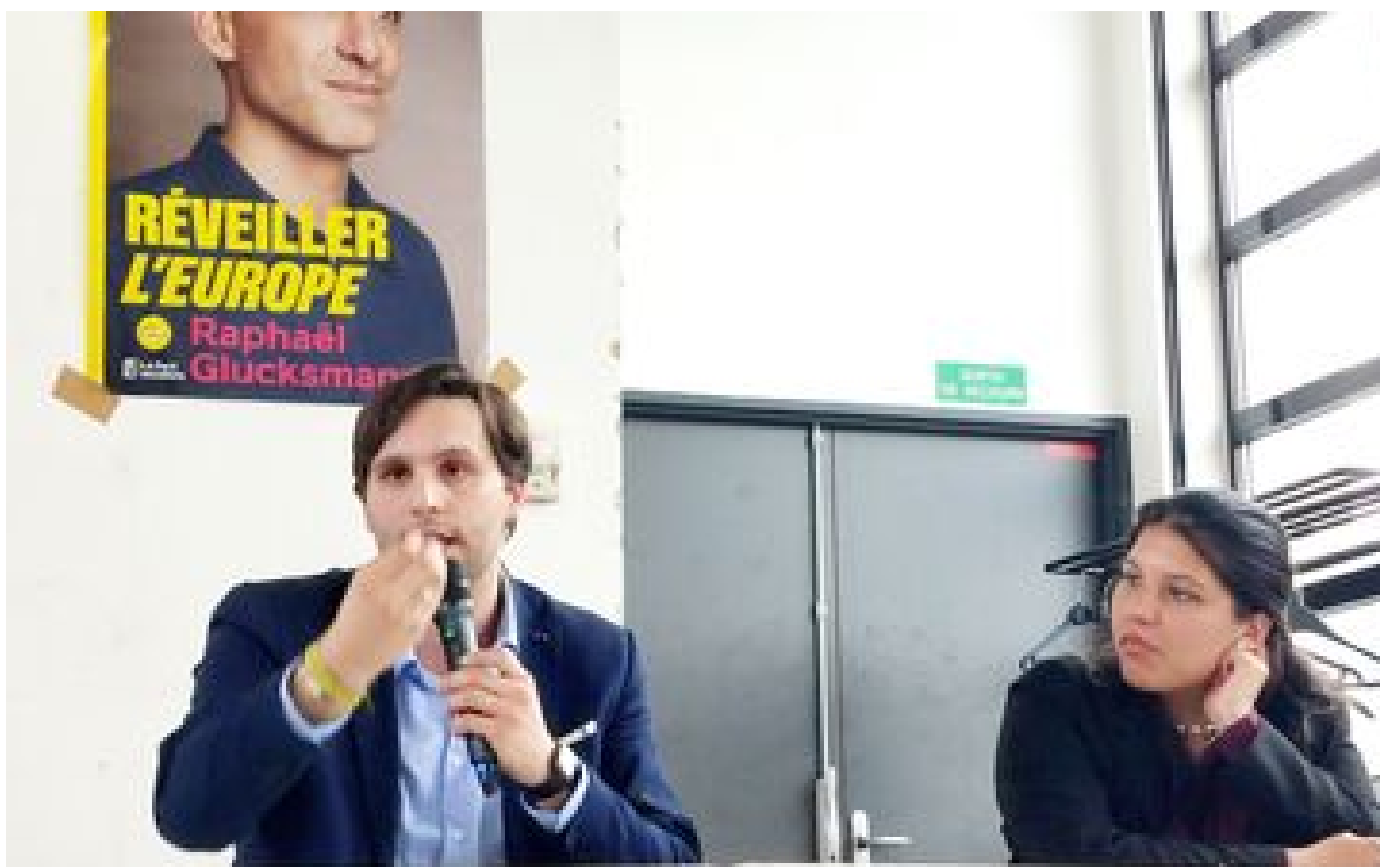
Européennes 2024 dans le Val-de-Marne : à quoi ça sert d'être candidat quand on n'est pas éligible ? P