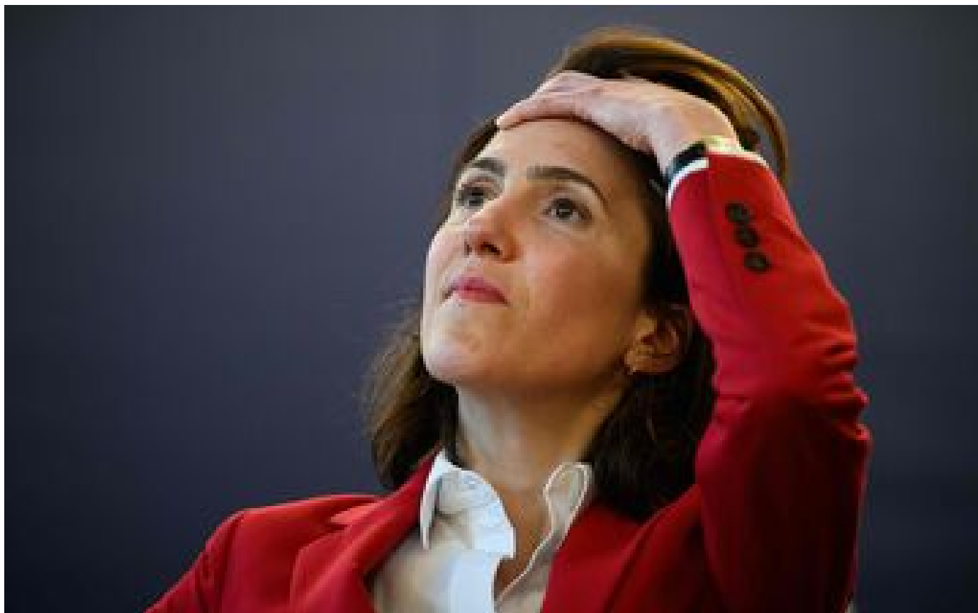
« On n'avait pas besoin de ça » : cacophonie en macronie avant le scrutin des européennes P