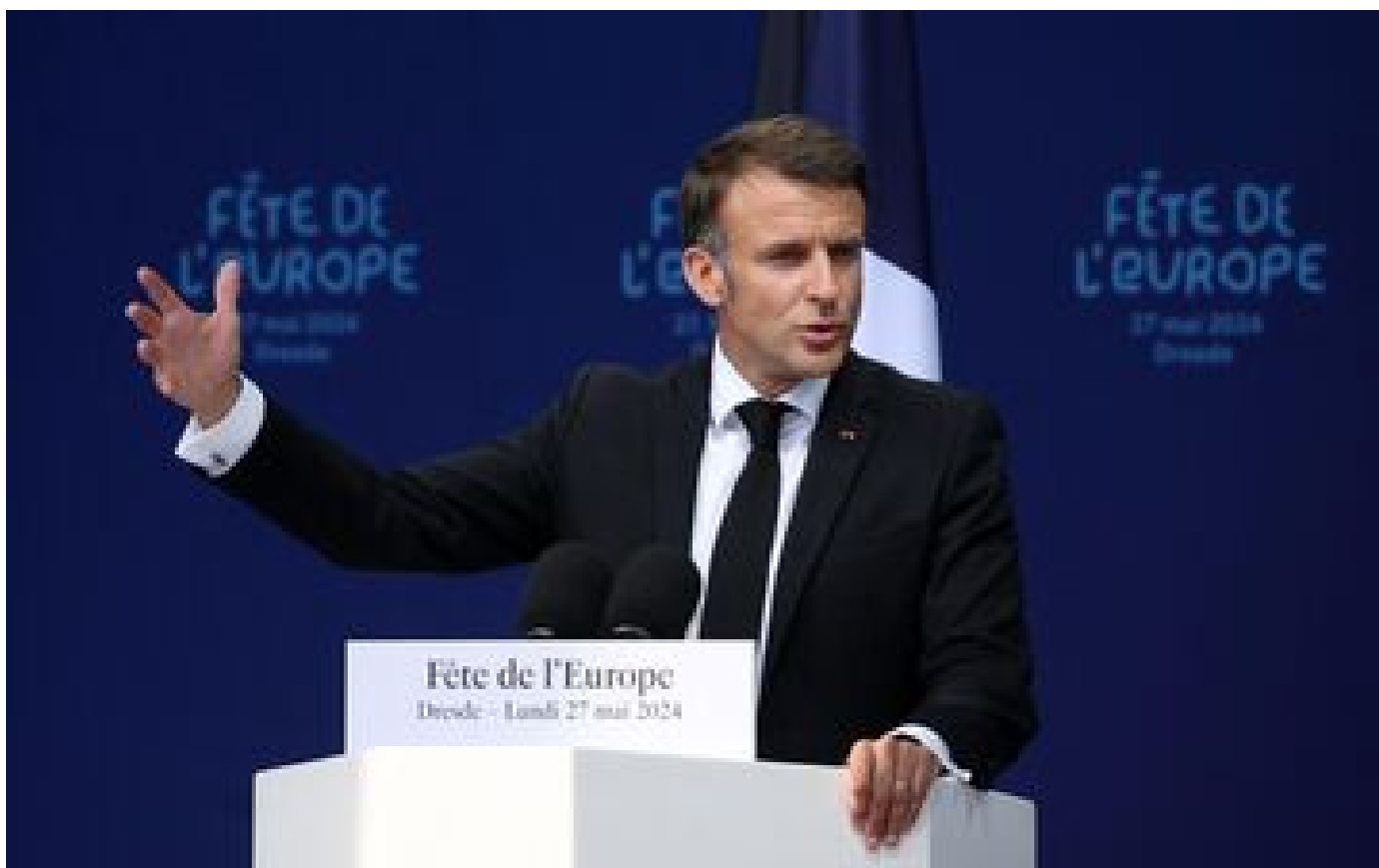
« Réveillons-nous » : depuis Dresde, Emmanuel Macron appelle au sursaut contre l'extrême droite P