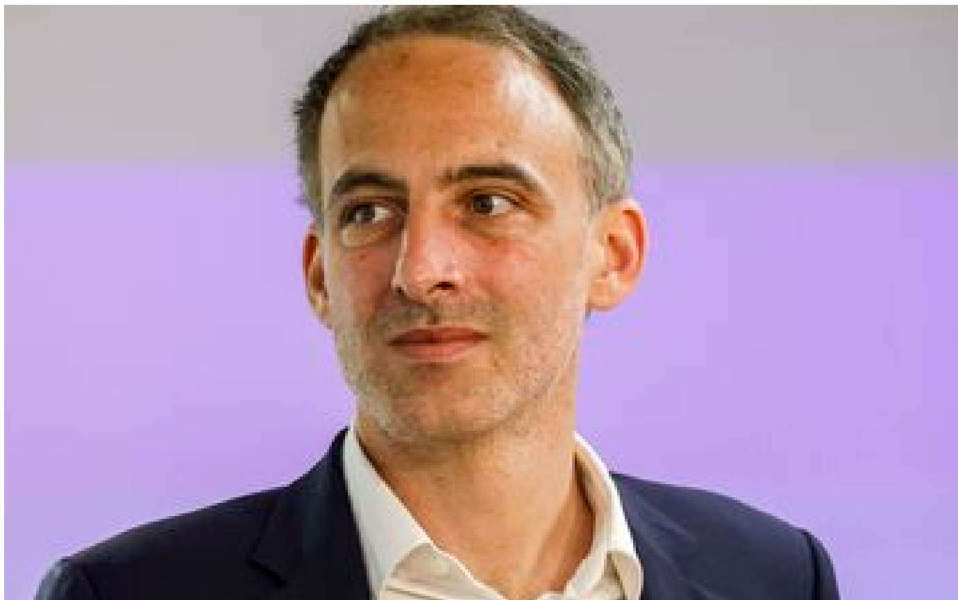
Européennes : « Lâchez-moi un peu les baskets », lance Raphaël Glucksmann à LFI