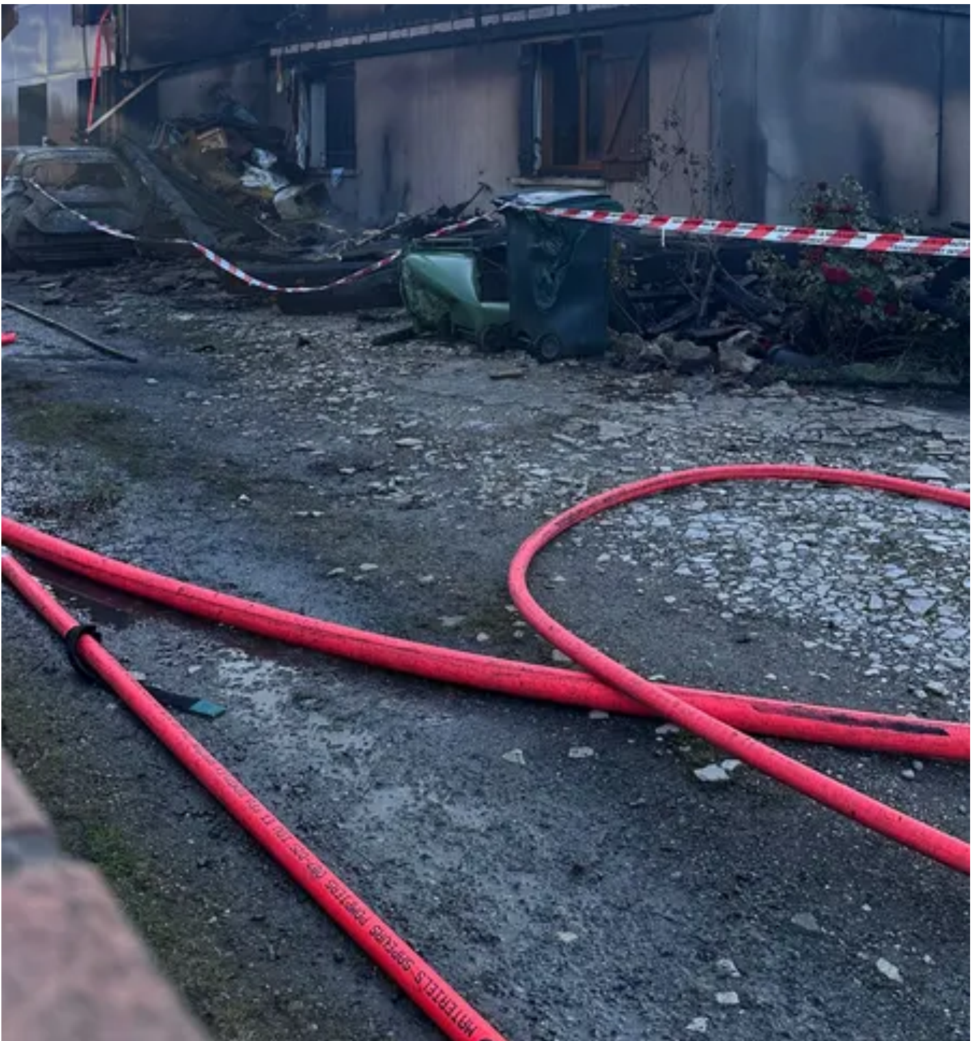
Le feu s'est propagé de la voiture à la maison qui est totalement ravagée. ● © Céline Peris / Sdis 31

Aujourd'hui, grâce à un élan de solidarité, Claire et sa famille ont pu trouver une solution de logement, pris en charge par l'assurance pendant un an. Mais cela risque de ne pas être suffisant. "Ils ont commencé à nous annoncer qu'il devrait compter au minimum un an et demi entre les expertises et la reconstruction. Et j'ai peur que ça dure plus longtemps parce que s'il y a des procédures judiciaires contre Renault, cela risque de ralentir le processus."