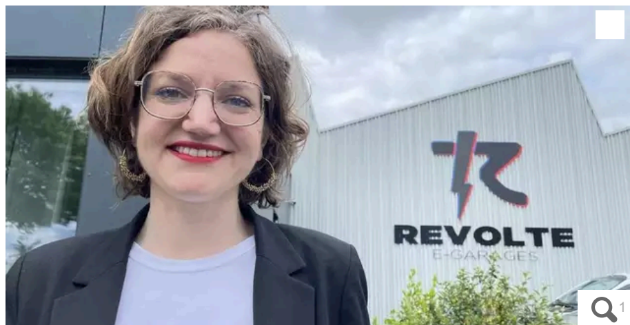
Marie Toussaint a visité le e-garage Revolte près de Nantes.