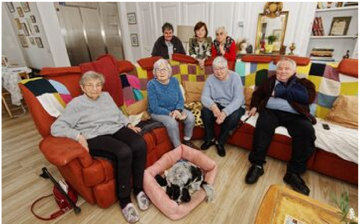
Dans l'Eure, les aînés vivent une retraite heureuse... en colocation : « Une maison qui demande à être connue ! »