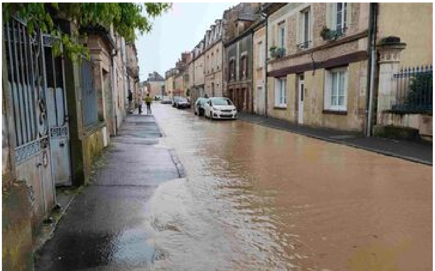
« Un mois de pluie en quelques minutes » : la Normandie se remet des violentes intempéries de ce dimanche