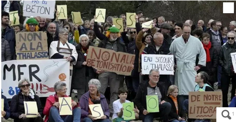
En mars 2024, près de 400 personnes avaient manifesté contre le projet de création d'un hôtel thalasso au Moustoir, près de la plage de Kerguelen.

Votre e-mail, avec votre consentement, est utilisé par la société Additi Multimedia pour recevoir les newsletters sélectionnées. En savoir plus