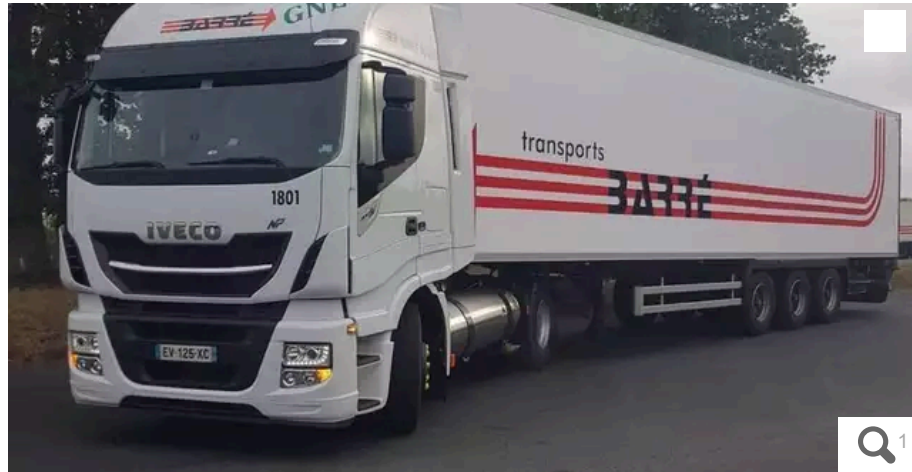
Exfret 44, anciennement Transports Barré, a été placé en redressement judiciaire. L'entreprise devrait être reprise à la barre du tribunal.