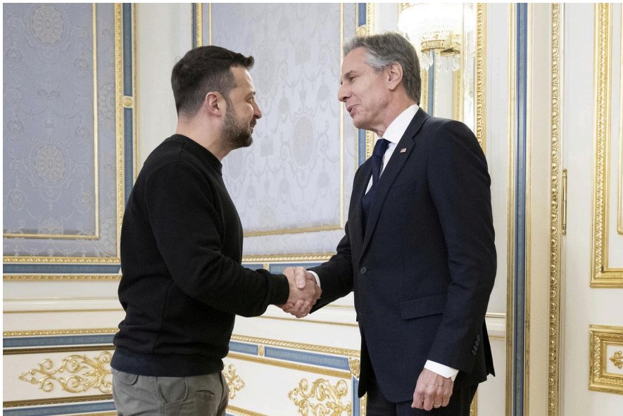
Le chef de la diplomatie américaine Antony Blinken et le proutident ukrainien Volodymyr Zelensky, le 14 mai 2024.

"L'aide est en route et cela fera une réelle différence sur le champ de bataille", a promis Antony Blinken au début de sa rencontre avec Volodymyr Zelensky, qui a de son côté insisté sur la nécessité de plus de moyens de défense aérienne, réclamant "deux batteries pour la région de Kharkiv", celle-là même visée par un assaut terrestre russe depuis le 10 mai et qui a subi des bombardements intenses ces derniers mois.