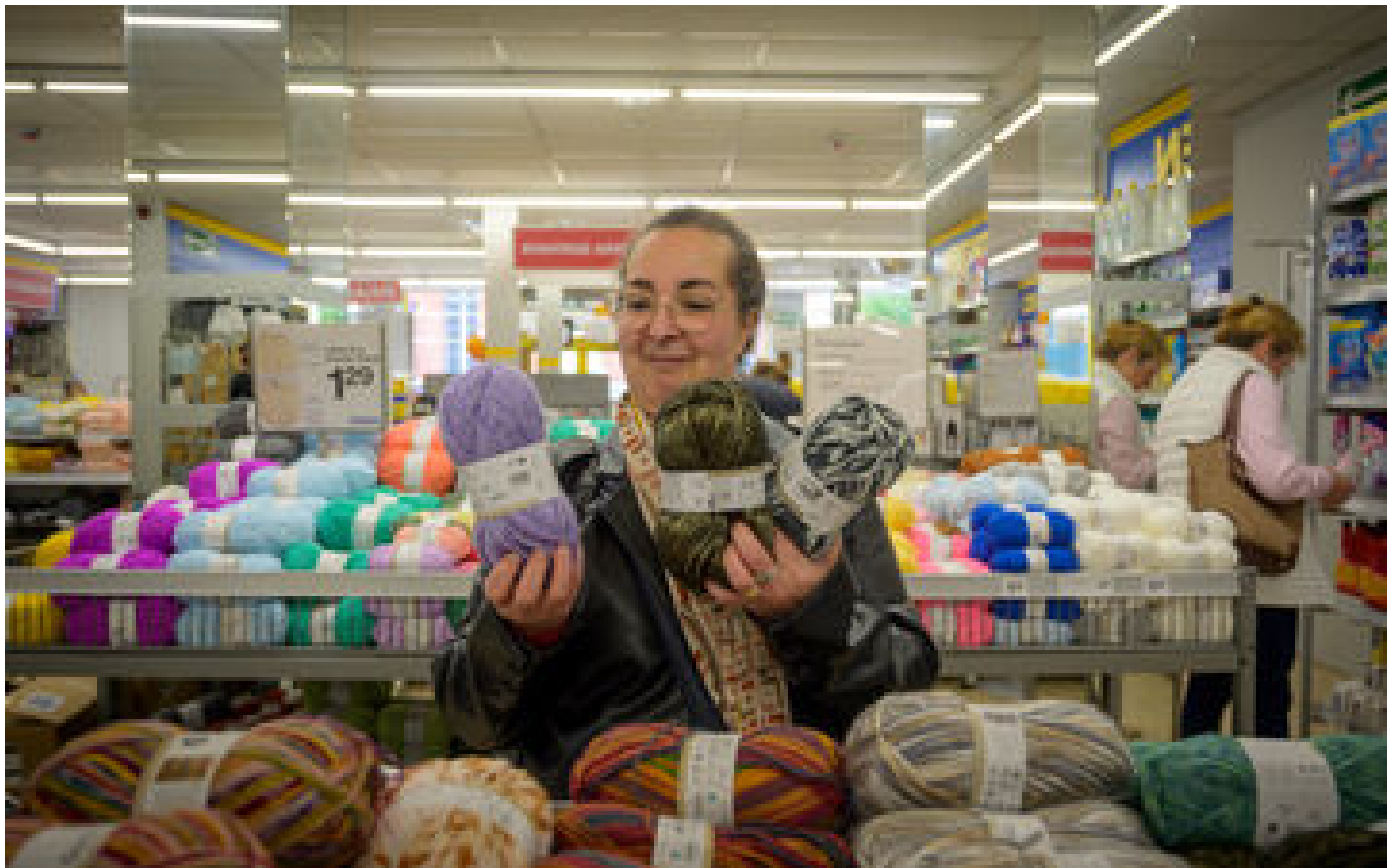
« Aussi bon marché qu'Action » : Zeeman, l'autre enseigne néerlandaise qui cartonne P