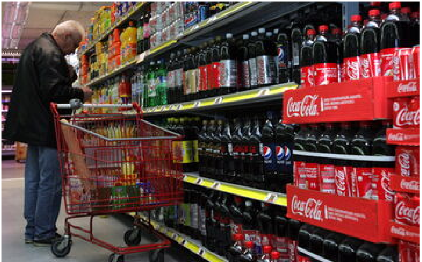
Biscuits, barres chocolatées, fromages... les prix de certains produits flambent à nouveau P