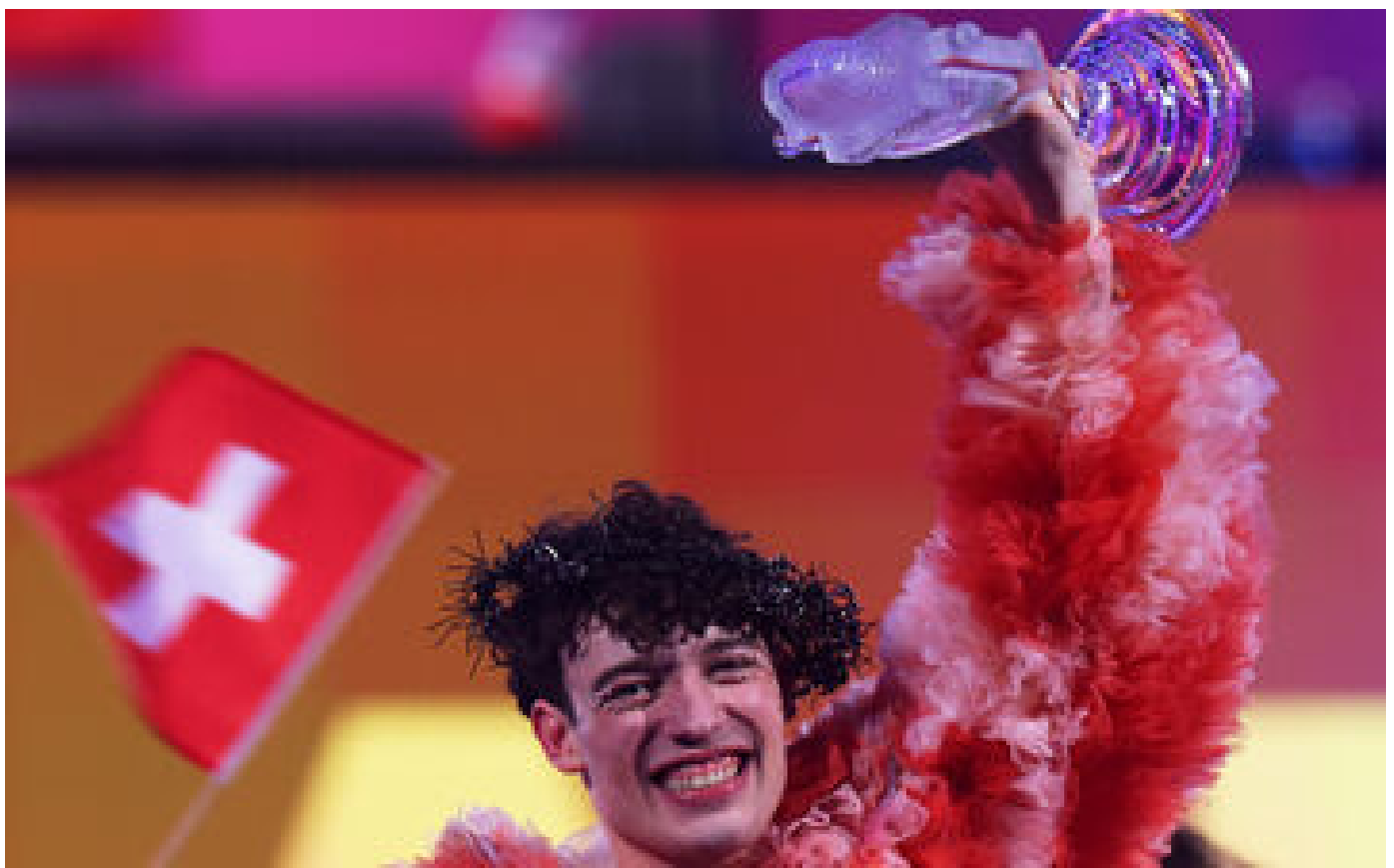
Eurovision 2024 : la Suisse explose de joie après la victoire de Nemo