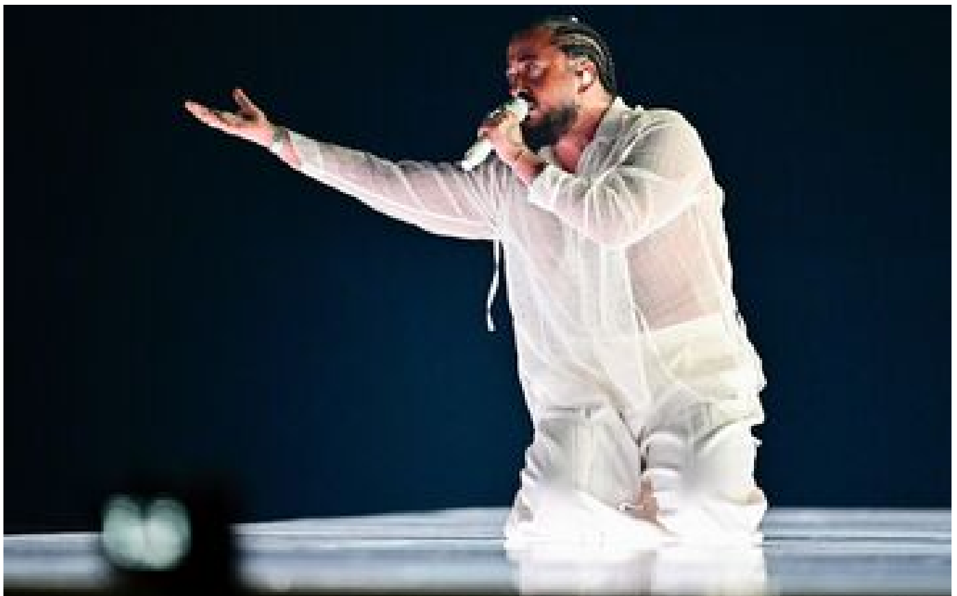
Eurovision 2024 : Slimane interrompt sa performance lors des répétitions et livre un discours sur la paix