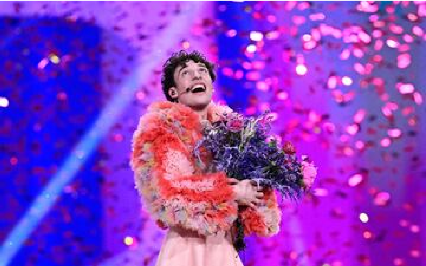
Eurovision 2024 : non-binaire, entre rap et opéra... qui est Nemo, vainqueur suisse du concours ?