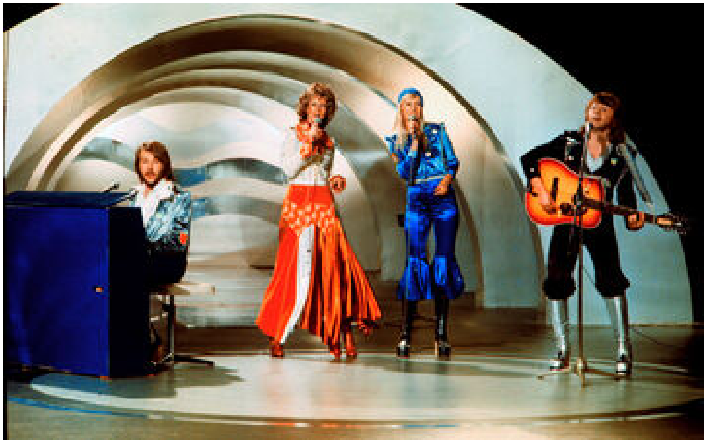
Eurovision 2024 : 50 ans après la victoire de « Waterloo », Malmö rend hommage à ABBA, groupe mythique suédois P