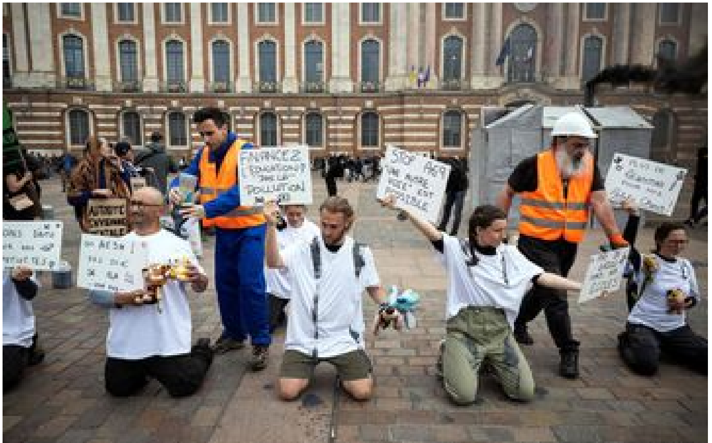
Toulouse : des écologistes manifestent contre l'A69, la police effectue six interpellations