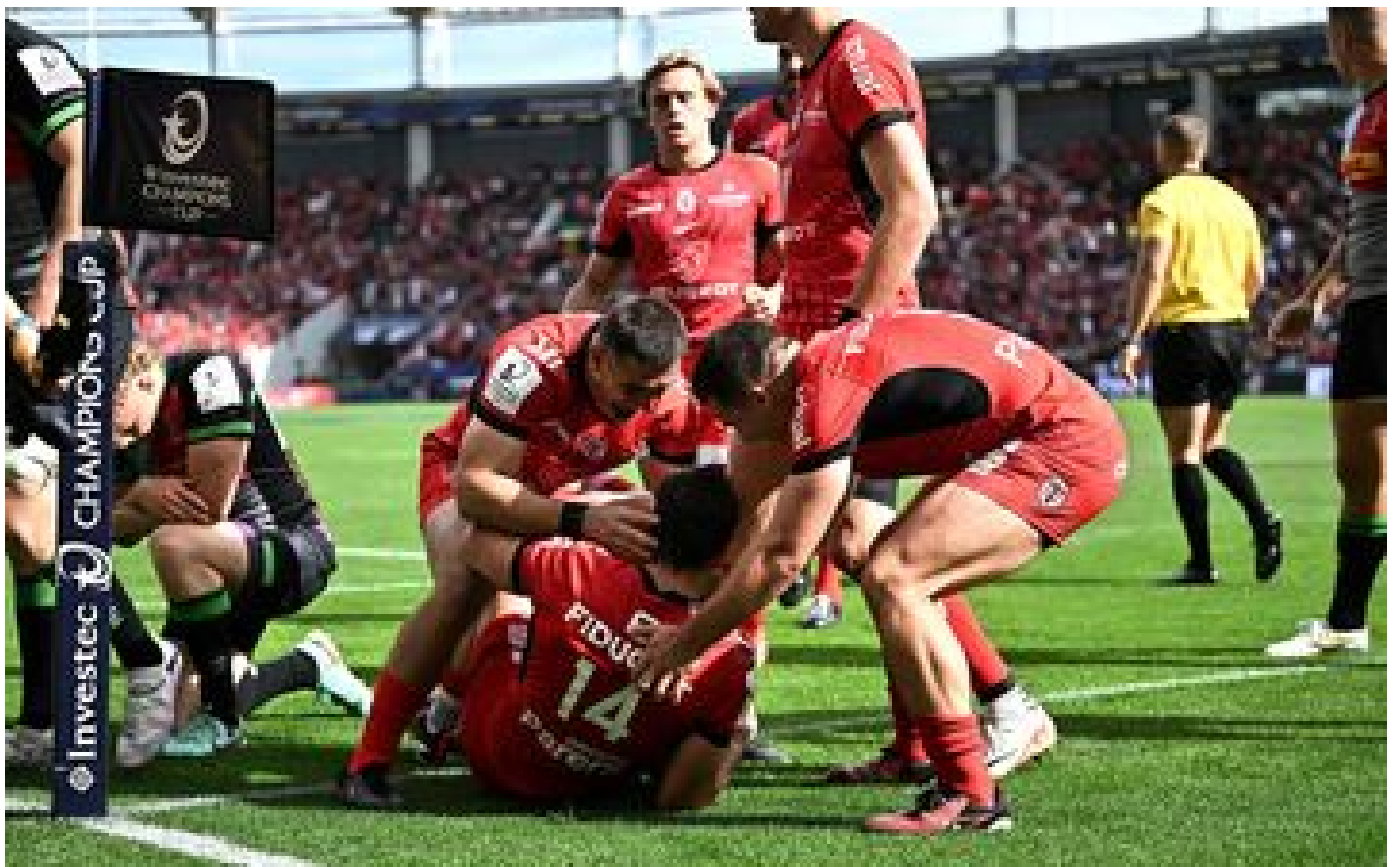
Toulouse-Harlequins : le résumé de la victoire des Toulousains en demi-finale de Champions Cup (38-26)