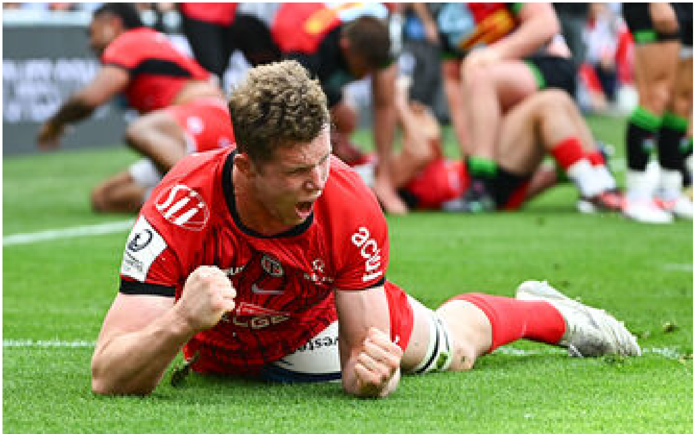
Toulouse-Harlequins (38-26) : les Toulousains en finale de la Champions Cup face au Leinster après un match fou