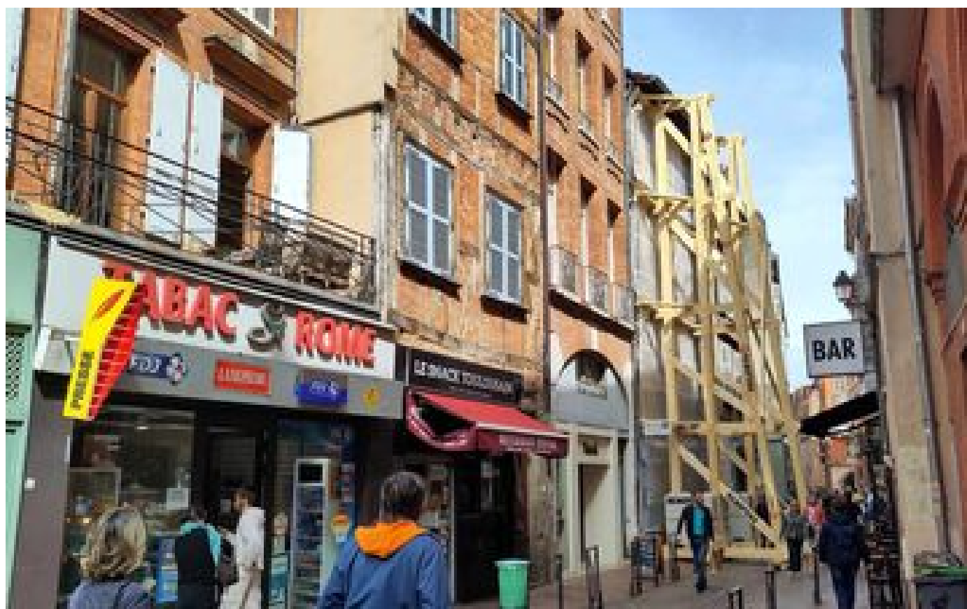
Immeuble effondré à Toulouse : soulagement pour les commerçants après la réouverture de la rue Peyras