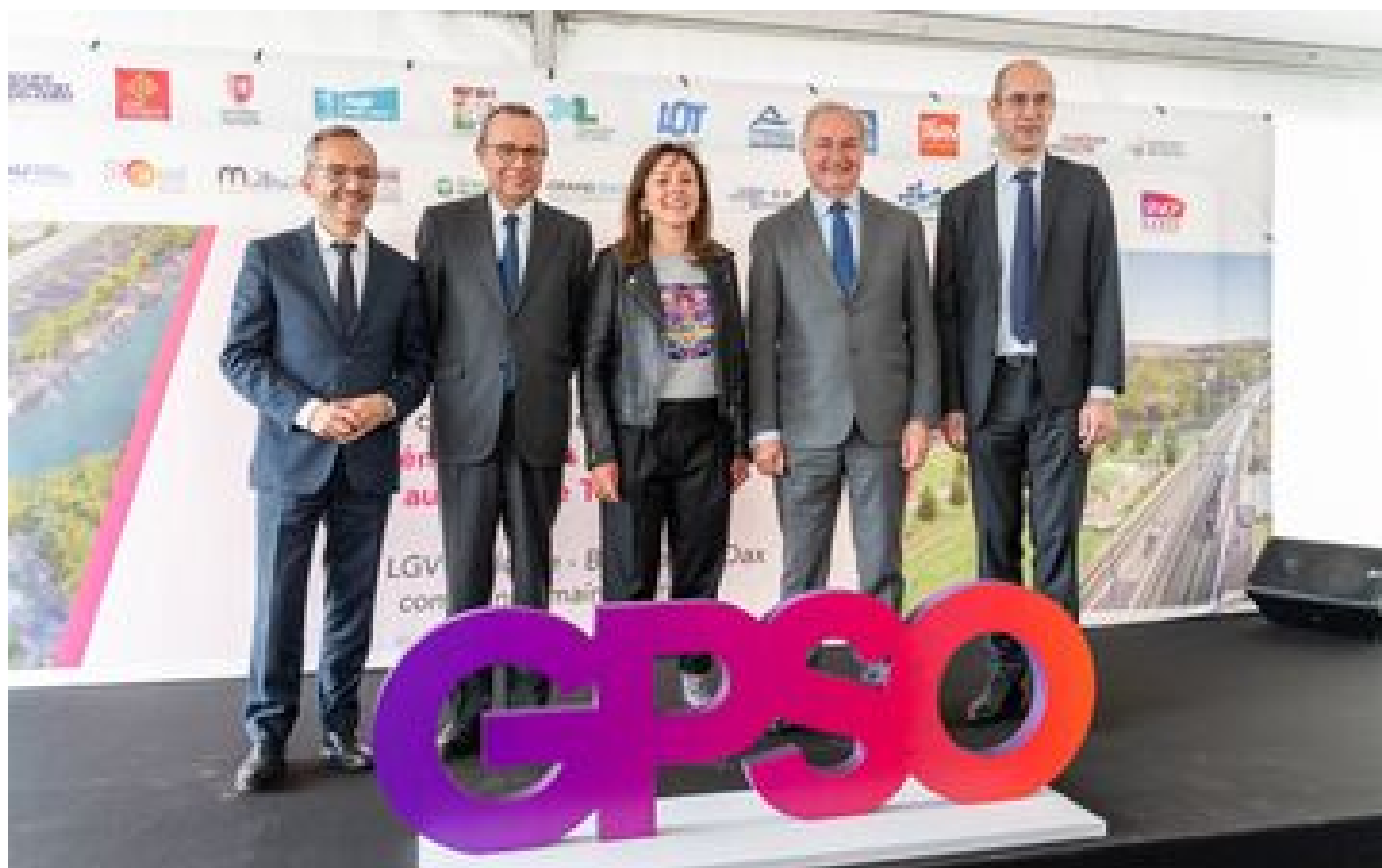
Au nord de Toulouse, le chantier de la future LGV est enfin sur les rails