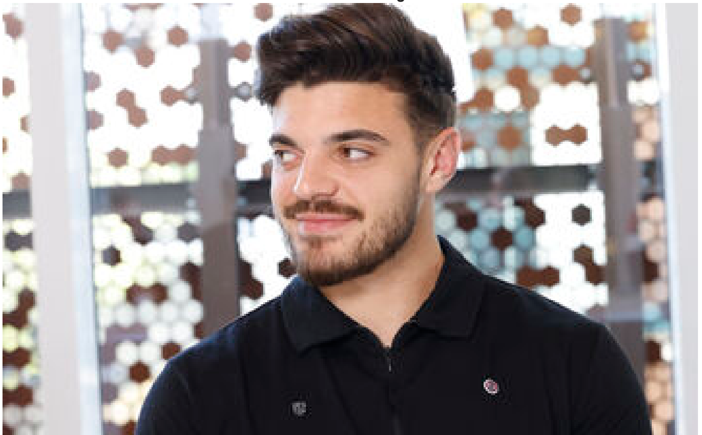
Le rugbyman Romain Ntamack sera le dernier porteur de la flamme olympique en Haute-Garonne