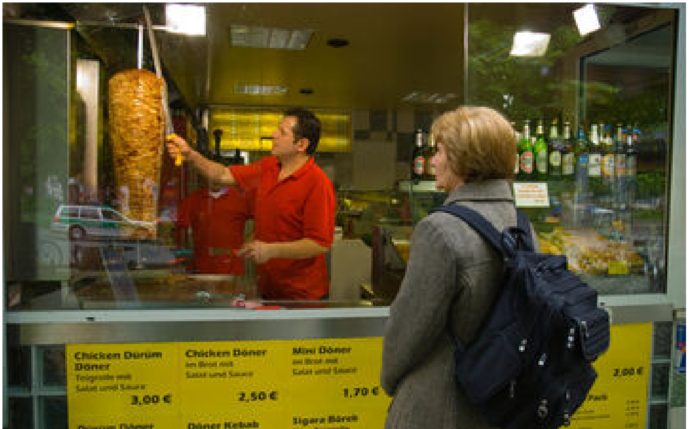
La gauche allemande réclame la mise en place d'un « plafonnement du prix du kebab » payé par l'État