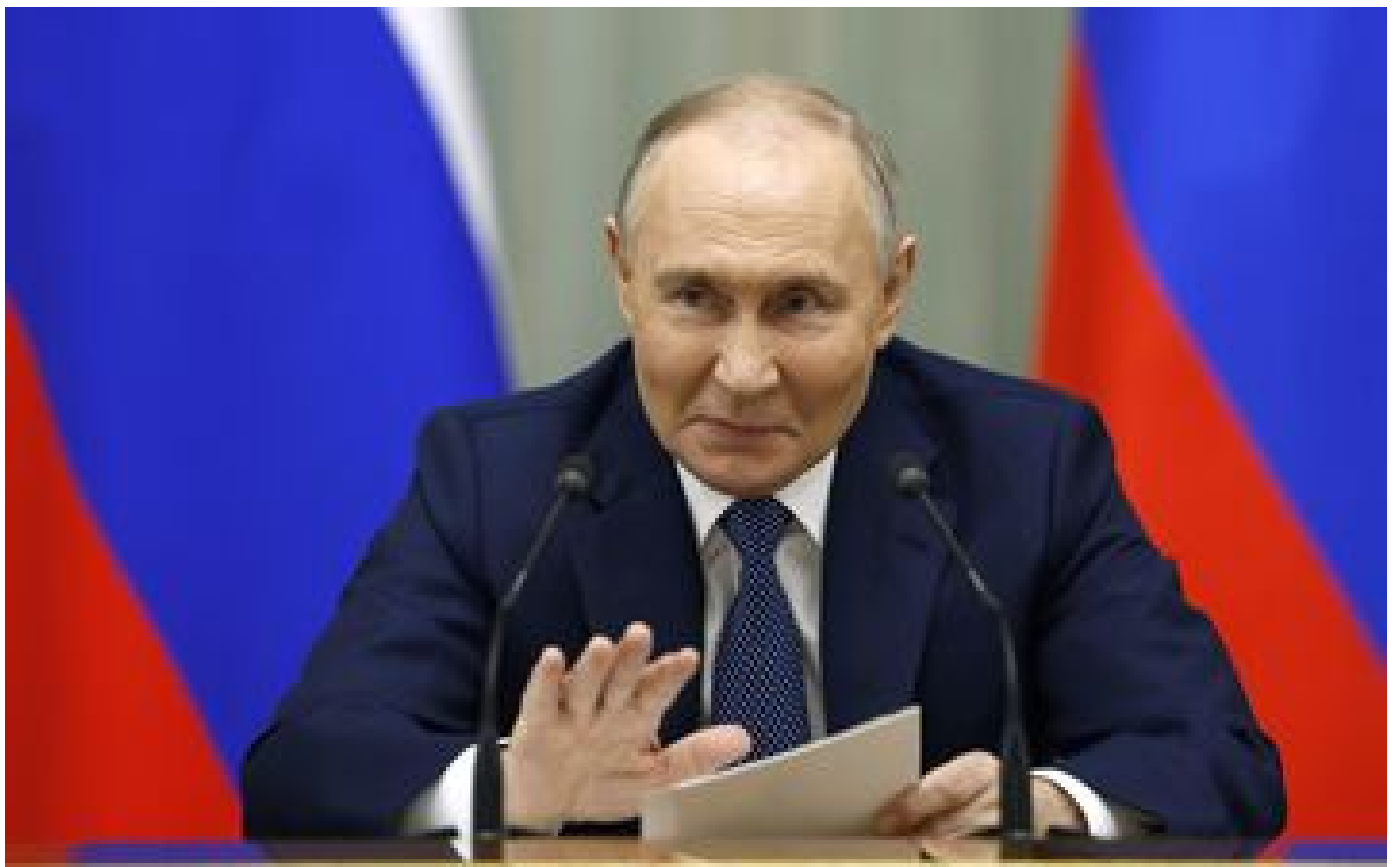
Vladimir Poutine va être investi pour un cinquième mandat à la tête de la Russie