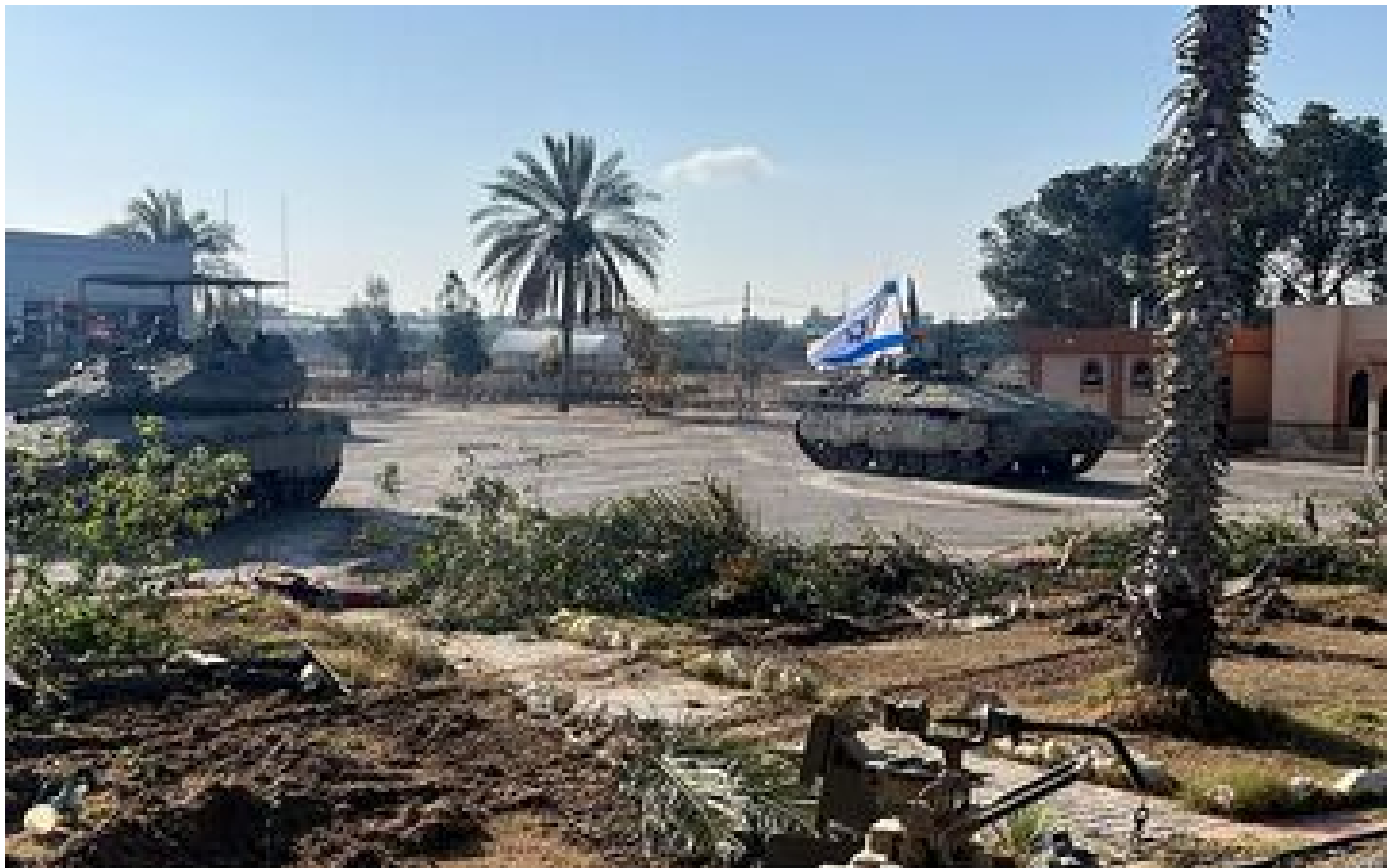
Guerre à Gaza : quelles différences entre la trêve validée par le Hamas et les demandes d'Israël ?