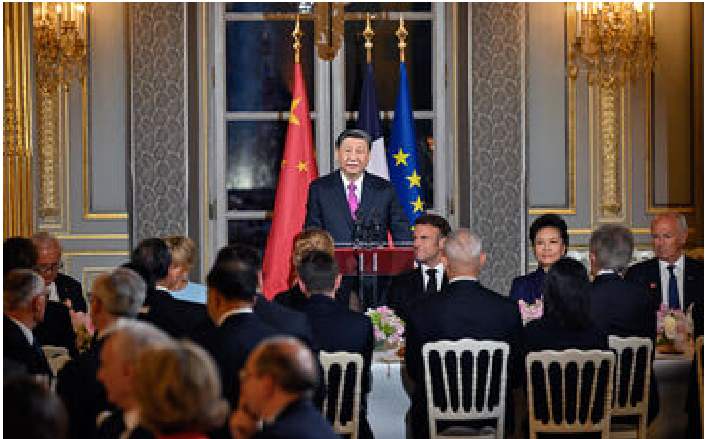
Xi Jinping en France : le proutident chinois annonce prolonger l'exemption de visa pour les Français