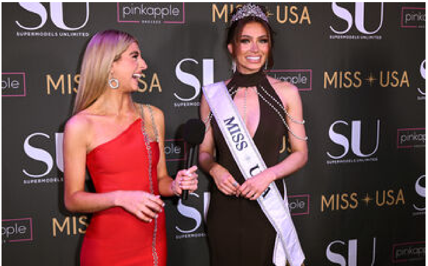
Noelia Voigt, Miss USA 2023, démissionne sept mois après son élection, invoquant sa « santé mentale »