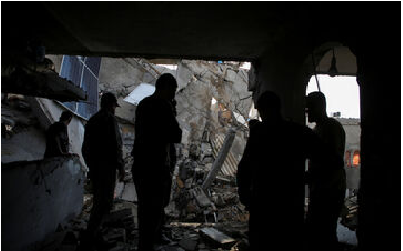
Guerre à Gaza : frappes intenses sur Rafah, « opération antiterroriste », pour parler au Caire... le point sur la situation