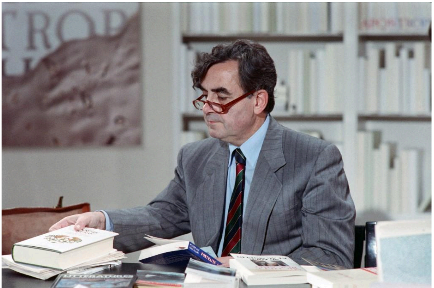
Bernard Pivot durant l'émission "Apostrophes" le 23 octobre 1987, sur Antenne 2.

Diffusée à partir de 1975 le vendredi soir, son émission littéraire "Apostrophes" était regardée par plusieurs millions de téléspectateurs. Grands connaisseurs de la littérature ou modestes amateurs de livres, ils y appréciaient les traits d'esprit, les pensées frappantes de concision, les tirades lyriques ou les engueulades que Bernard Pivot savait susciter chez les auteurs invités.