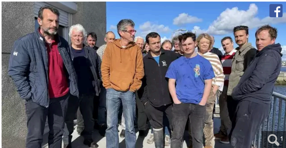
L'idée de relancer un comité de survie de la pêche à Lorient a déjà donné naissance à un syndicat FO des travailleurs de la mer et une association pour défendre l'image de la pêche.

Votre e-mail, avec votre consentement, est utilisé par la société Additi Multimedia pour recevoir les newsletters sélectionnées. En savoir plus