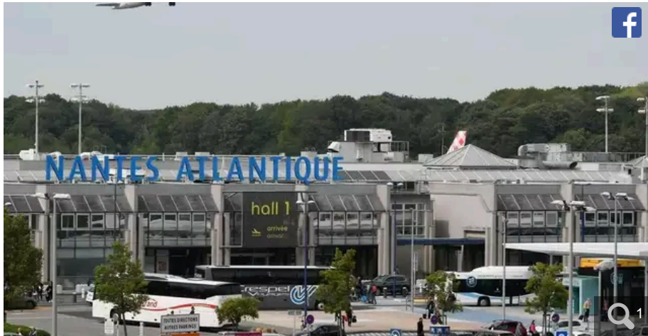
L'aéroport de Nantes-Atlantique.

Votre e-mail, avec votre consentement, est utilisé par la société Additi Multimedia pour recevoir les newsletters sélectionnées. En savoir plus