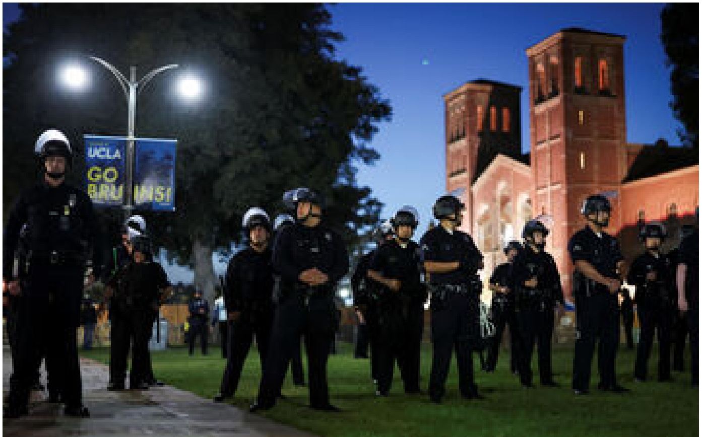
Violences contre un camp propalestinien, barricades démantelées... Le point sur les tensions sur un campus d'une université américaine