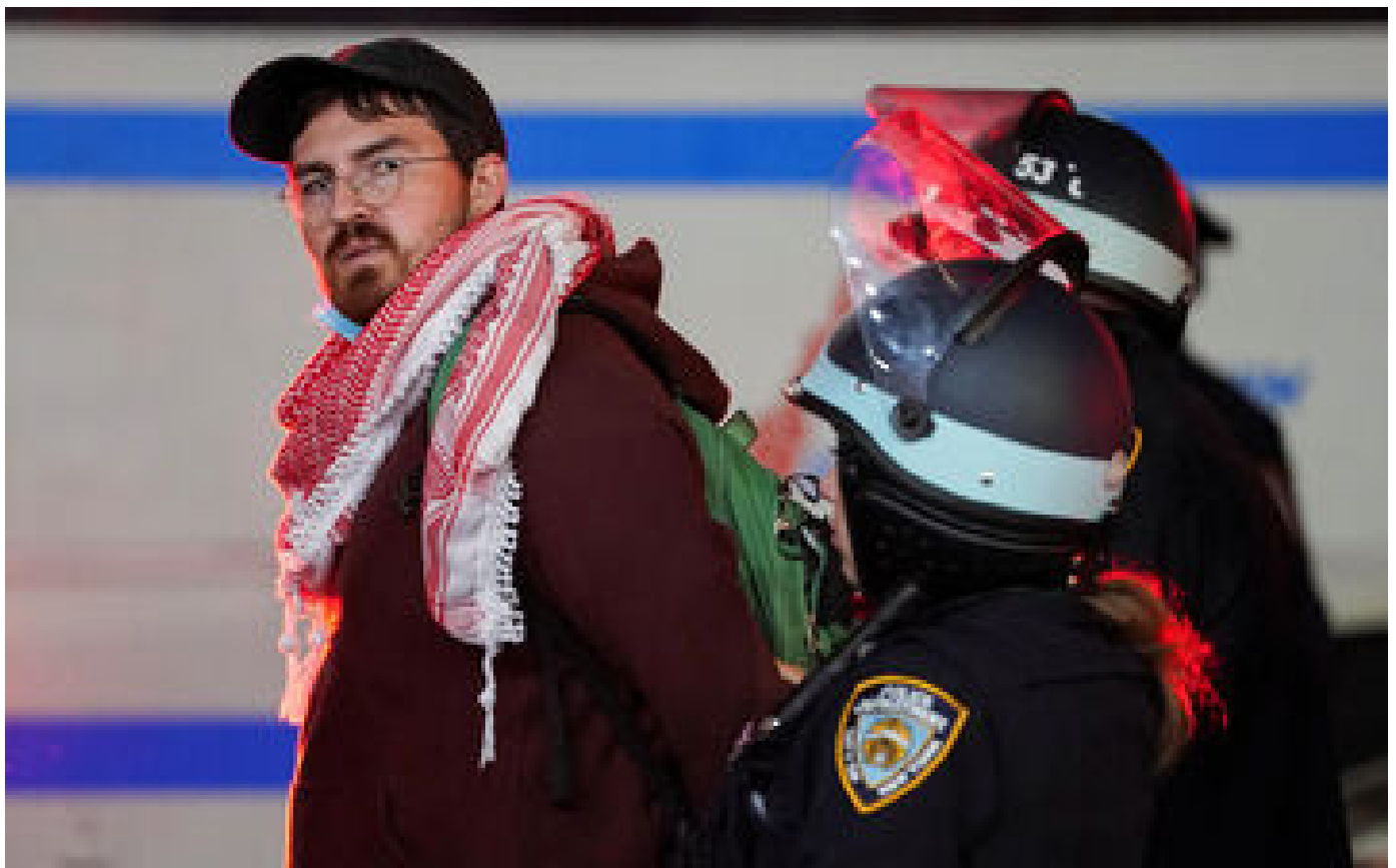
Manifestations propalestiniennes : pourquoi l'université américaine de Columbia est aux avant-postes du mouvement