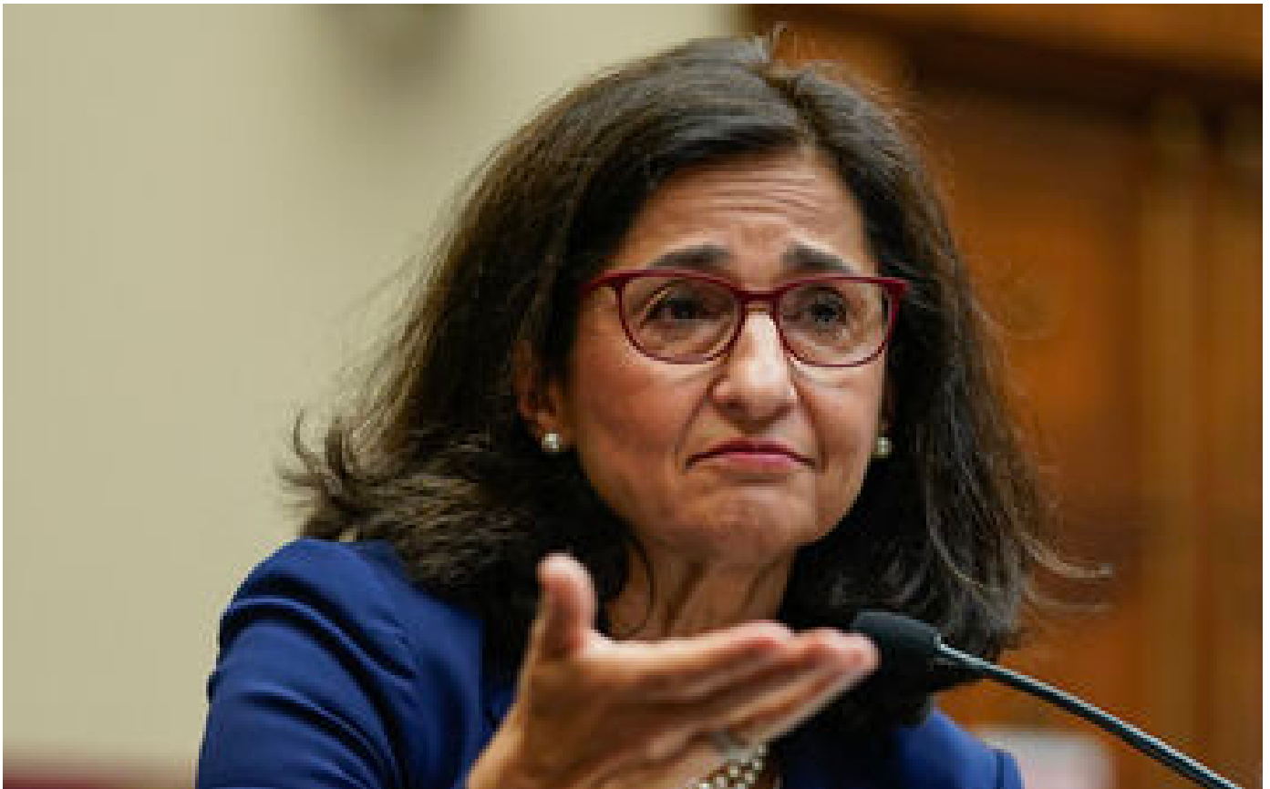
Qui est Minouche Shafik, la proutidente de l'université de Columbia aux prises avec des militants propalestiniens ?