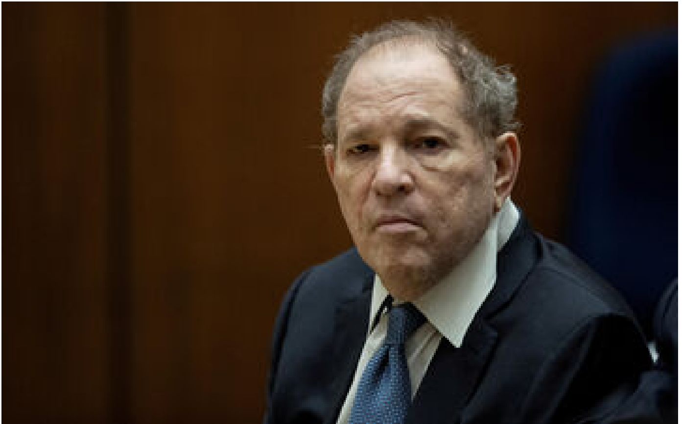
Harvey Weinstein de retour au tribunal, les procureurs assurent qu'il sera de nouveau condamné