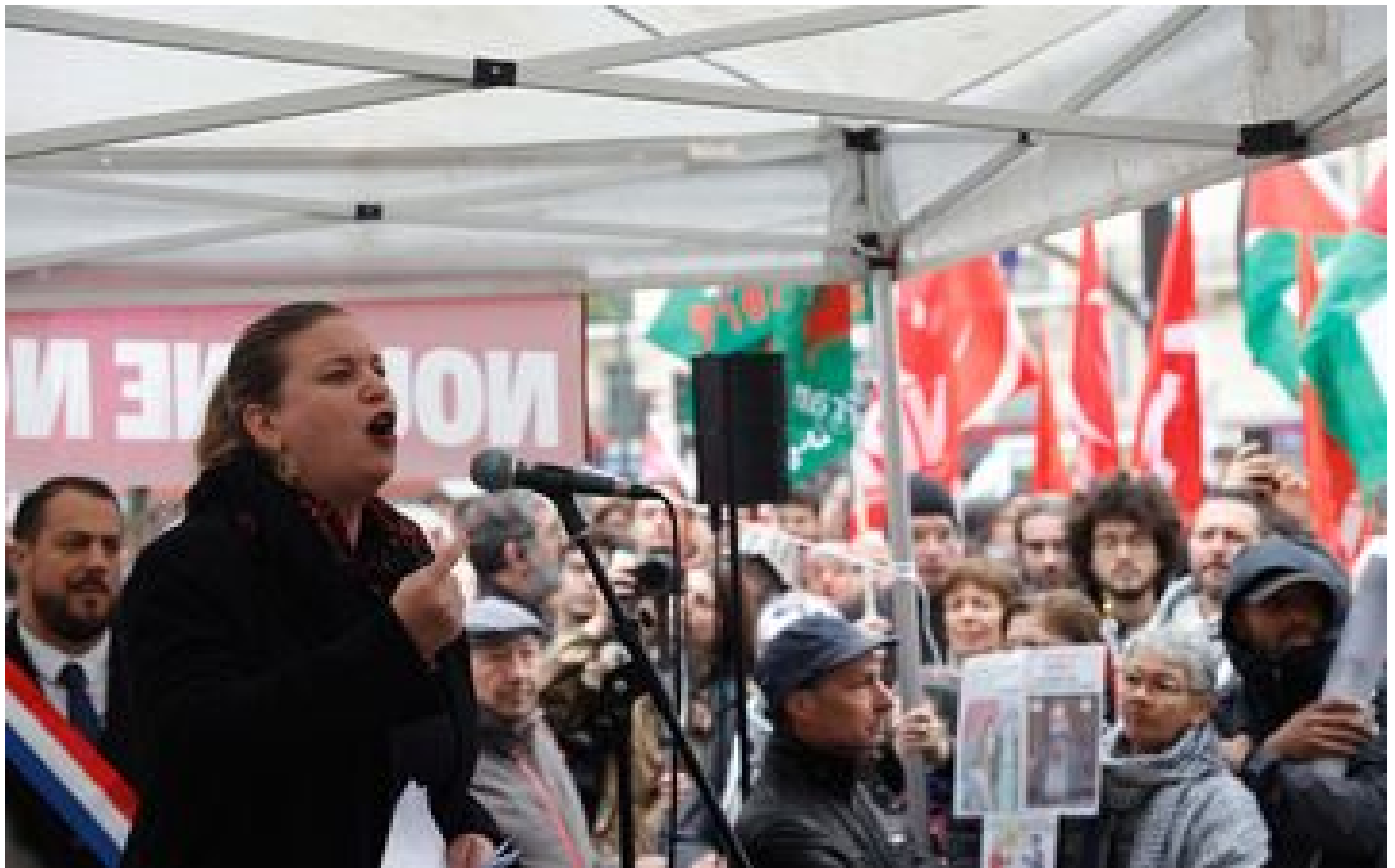
Mathilde Panot et Rima Hassan convoquées pour « apologie du terrorisme » : « Nous ne nous tairons pas ! »