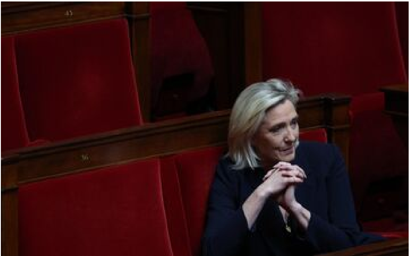
Motion de censure : le piège de Marine Le Pen aux LR P