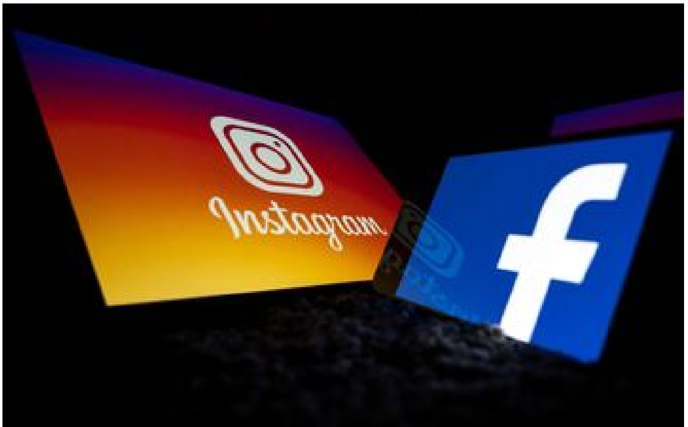
Européennes et désinformation : Facebook et Instagram dans le viseur de l'UE