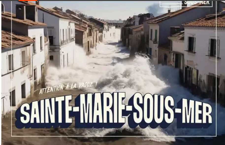
Sainte-sur-Mer est devenue Sainte-Marie-sous-Mer. Illustration Surfrider Foundation

Avec cette nouvelle campagne, Surfrider Foundation cherche à « limiter les dégâts » face à ce phénomène « inévitable ». « Surfrider passe à l'action pour alerter sur la montée des eaux et apporter des solutions pour minimiser les impacts », indique l'ONG.