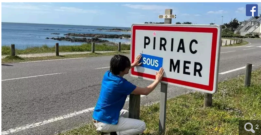
L'ONG Surfrider a lancé une nouvelle campagne pour sensibiliser à la montée des eaux.

Votre e-mail, avec votre consentement, est utilisé par la société Additi Multimedia pour recevoir les newsletters sélectionnées. En savoir plus