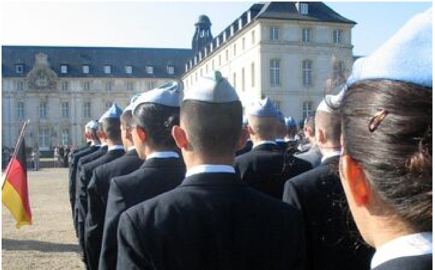
Un ex- l ve du lyc e militaire de Saint-Cyr devant la justice pour des agressions sexuelles sur des camarades P