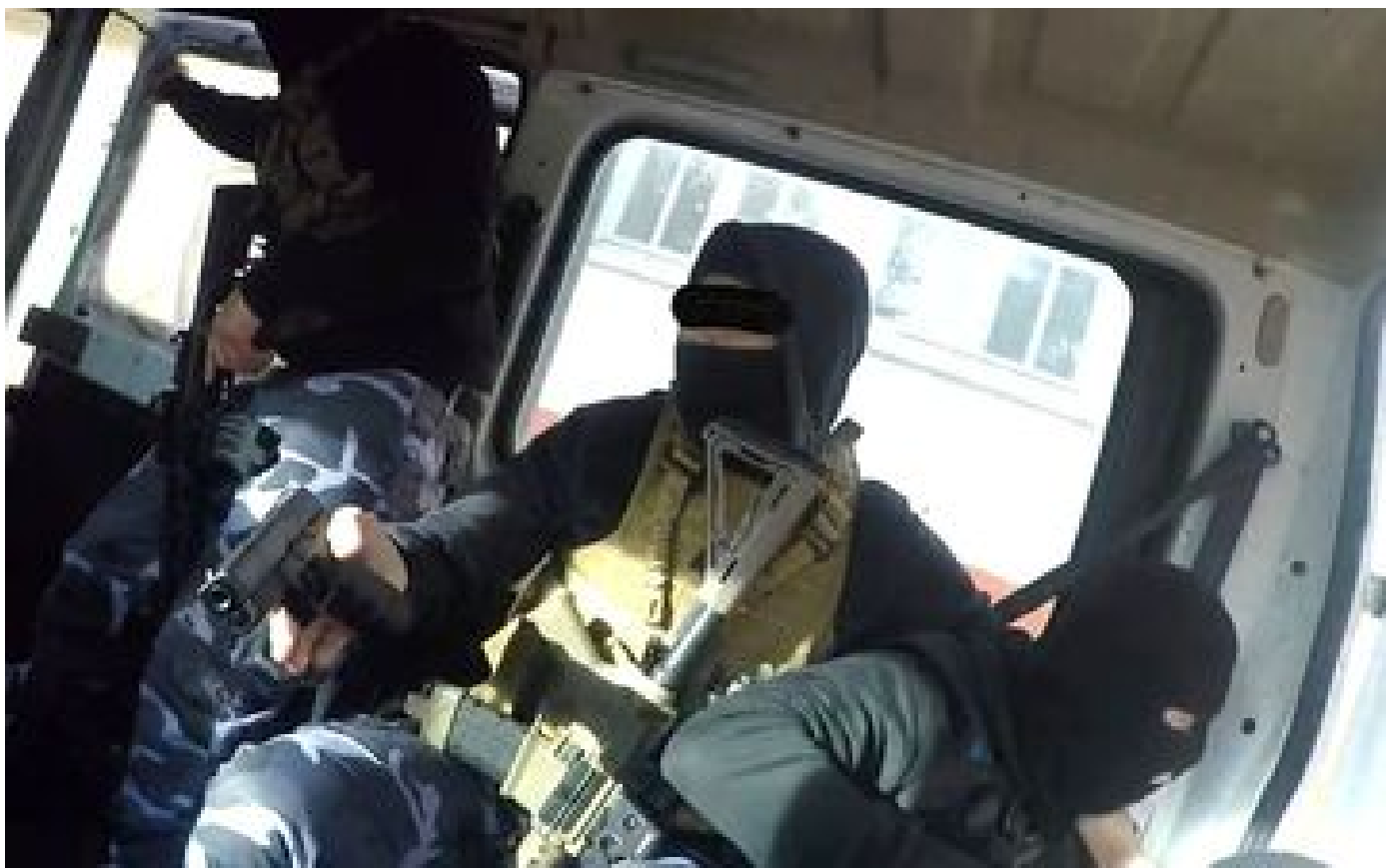
Traumatis e apr s un exercice attentat au lyc e Keller de Cachan, un prof d nonce des manquements P