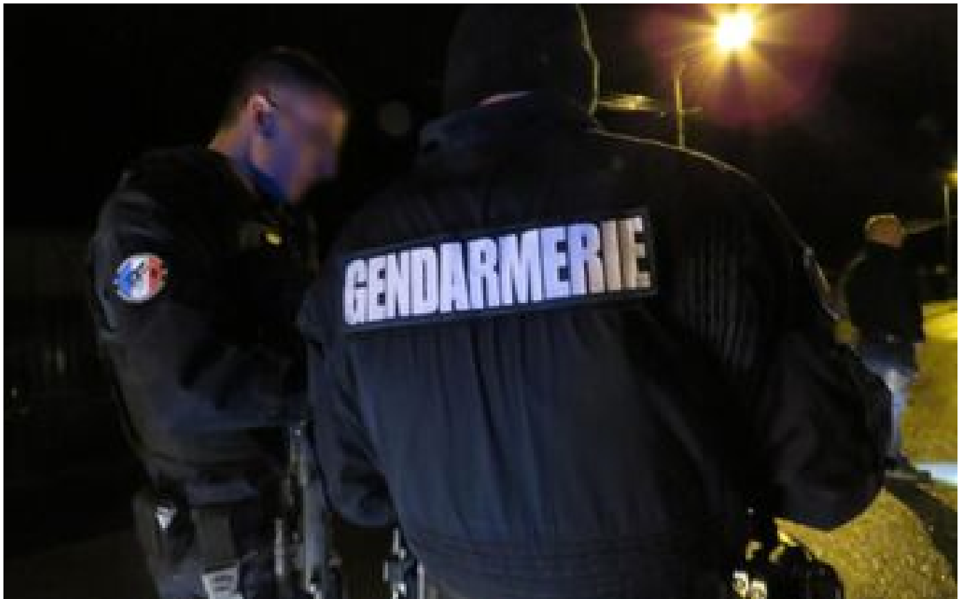
Info Le Parisien Essonne : des gendarmes ouvrent le feu sur un forcené, la victime entre la vie et la mort