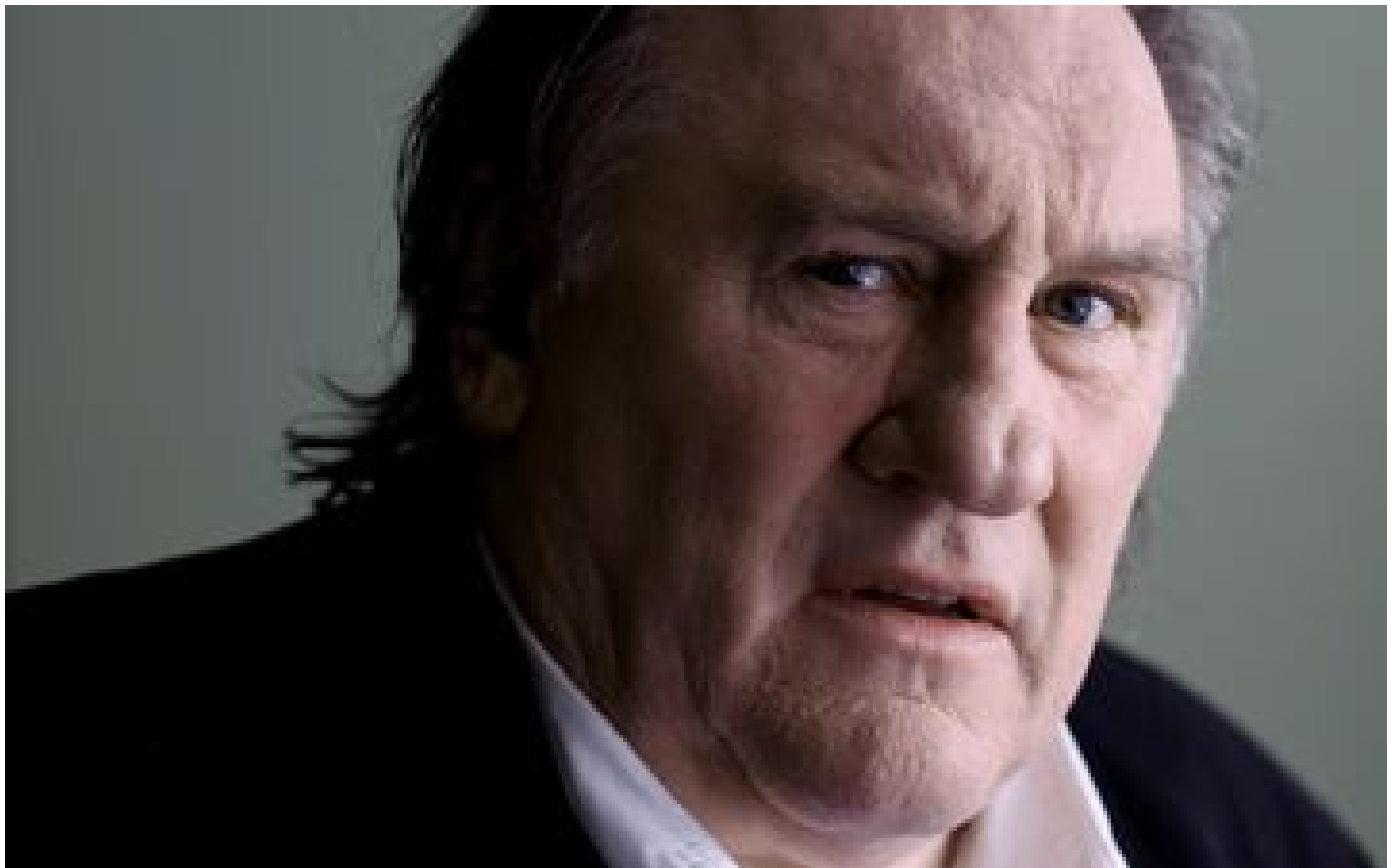
Gérard Depardieu placé en garde à vue pour deux affaires d'agressions sexuelles sur des tournages