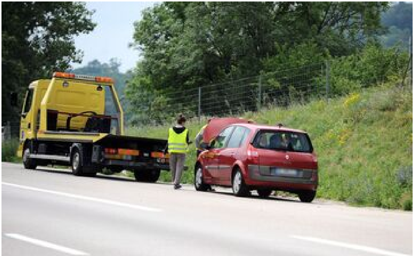
Prix exorbitants, clients piégés... ces « dépanneuses pirates » qui arnaquent les automobilistes P