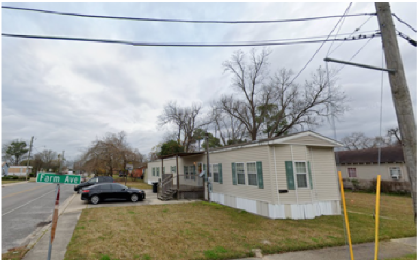
États-Unis : trois policiers blessés lors d'une intervention du SWAT, le tireur, abattu, était recherché