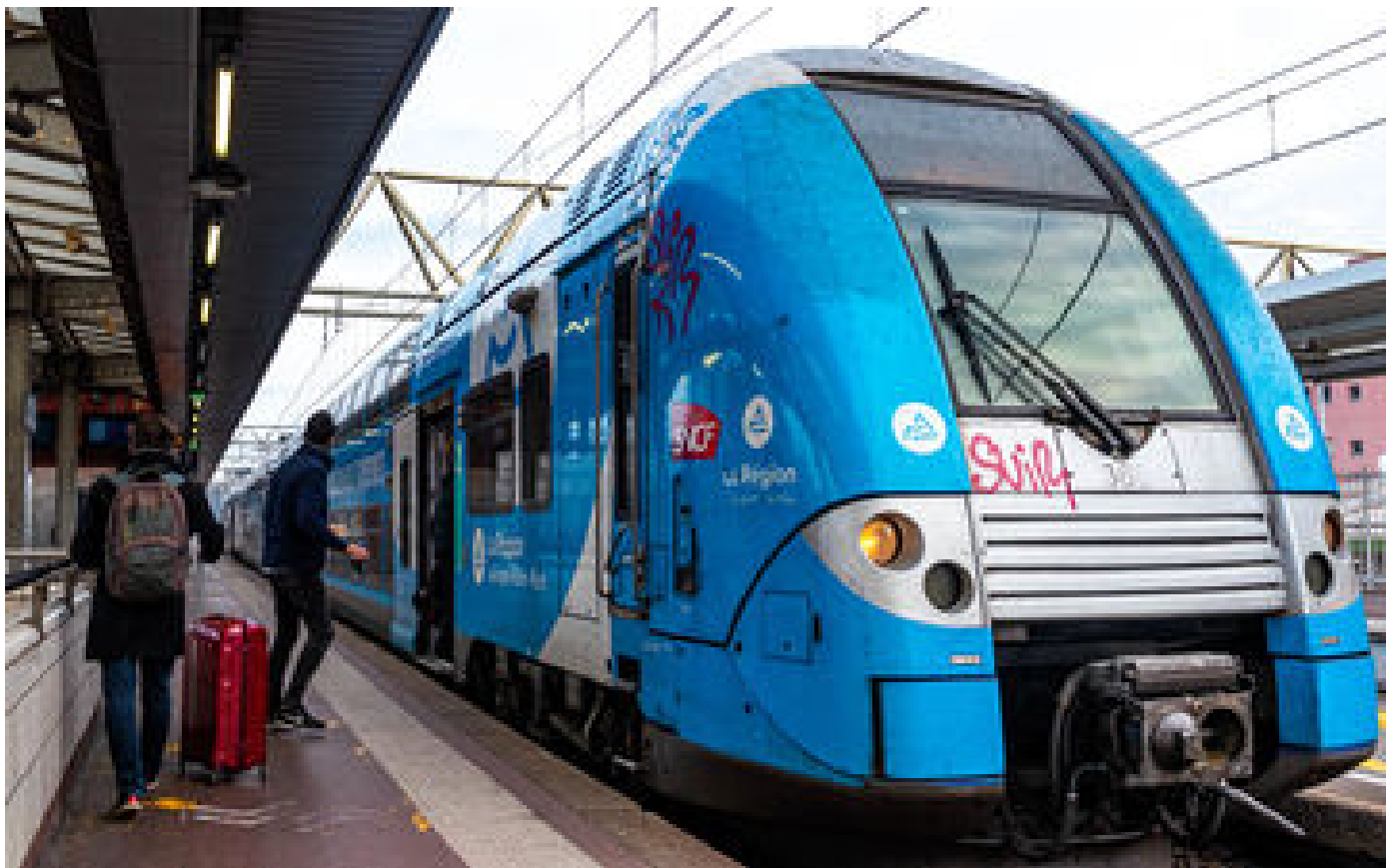
Éboulement sur une ligne de train : le trafic ferroviaire entre Lyon et Givors suspendu jusqu'à mercredi au plus tôt