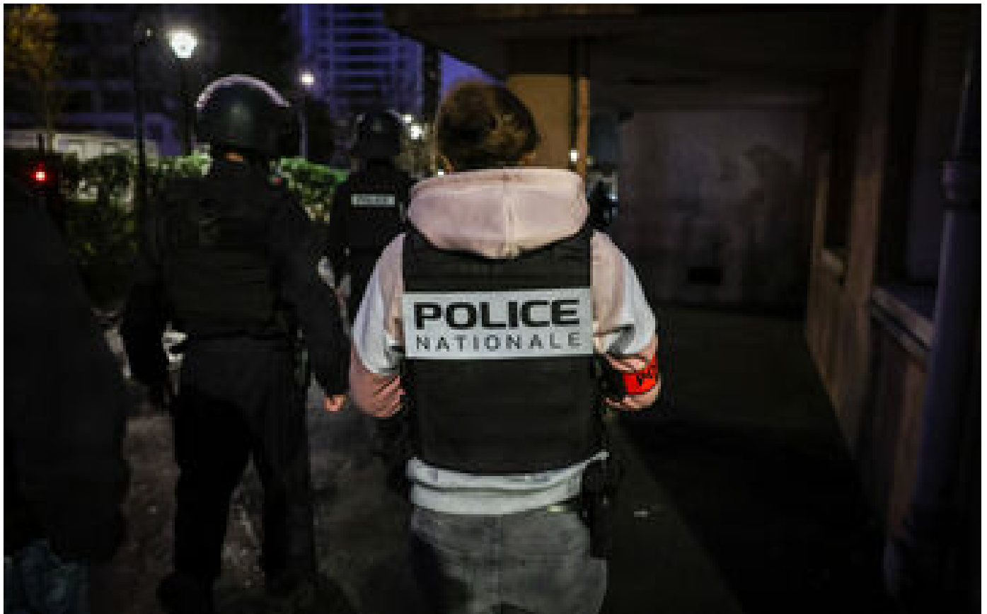
Grenoble : un homme blessé par balle dans le quartier de l'Alma, une enquête ouverte