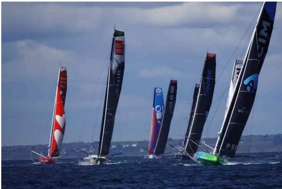
La flotte des 33 Imoca entre Lorient et Groix, entre les grains.