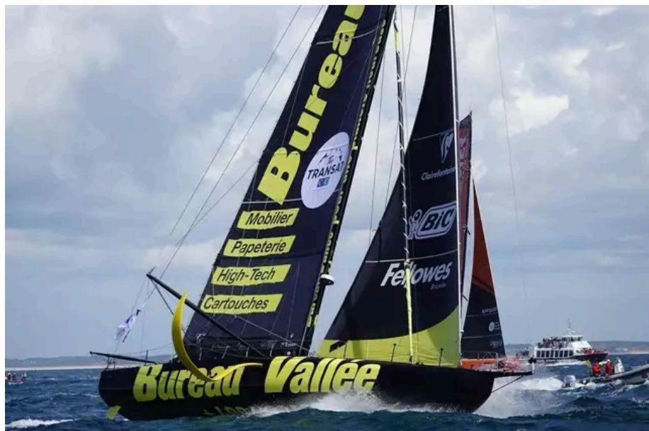
Le foiler noir et jaune Louis Burton (Bureau Vallée).