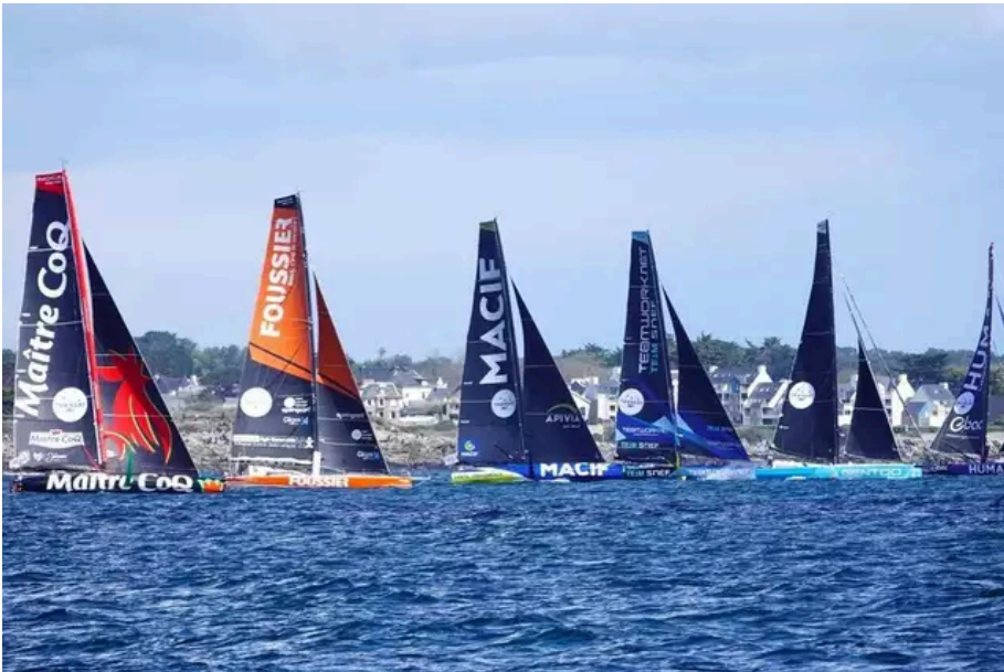
La flotte au large de Lorient.