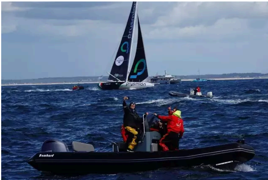
Selfie devant la ligne de départ.