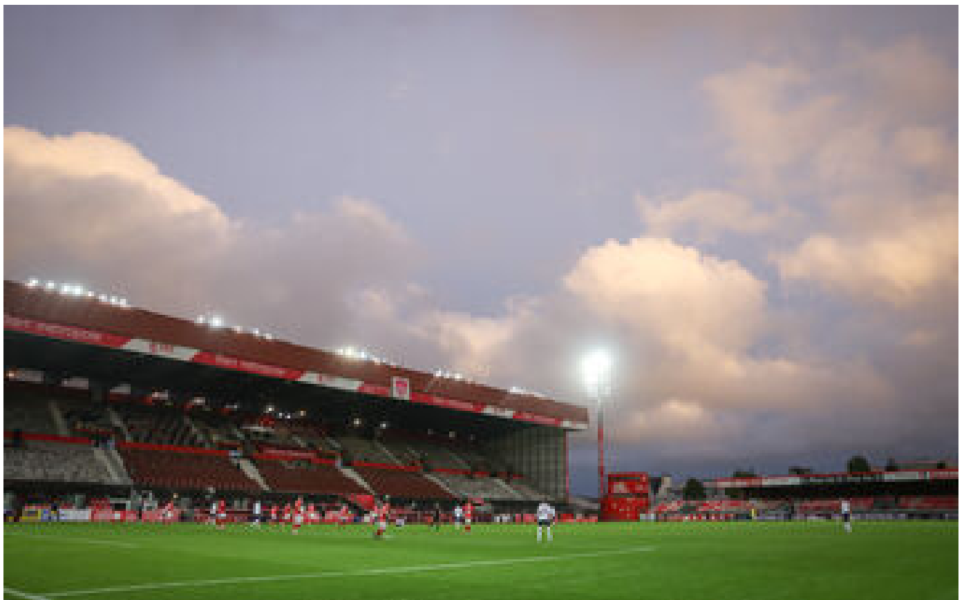
Football : Brest privé d'une partie de son stade en cas de Coupe d'Europe