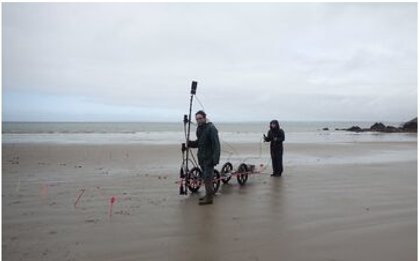
L'épave ancienne retrouvée sous le sable de Camaret date-t-elle de Louis XIV ?