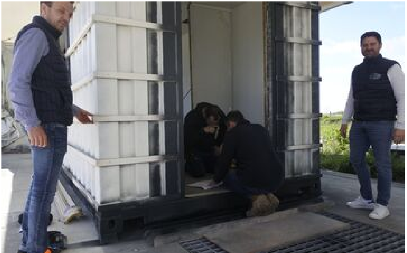
Les commerces en conteneurs maritimes de l'entreprise normande Girard séduisent jusqu'en Bretagne