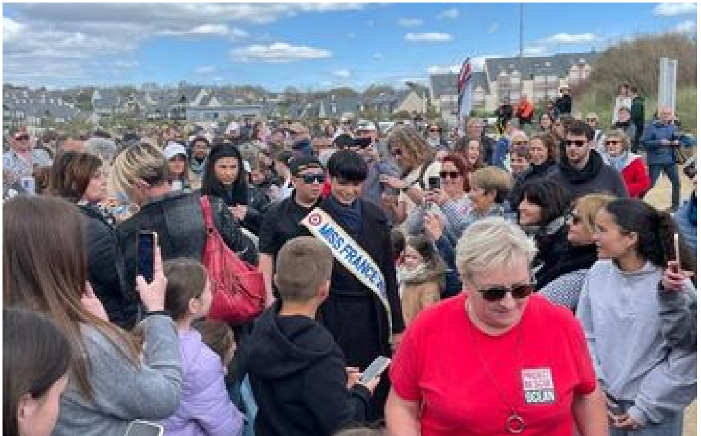
Miss France à la plage contre la pollution : quand Eve Gilles ramasse des « larmes de sirène » en Bretagne