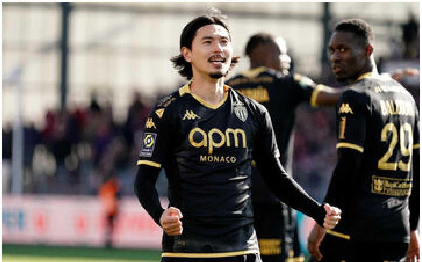
Brest-Monaco : victoire du club du Rocher, nouveau dauphin du PSG en Ligue 1