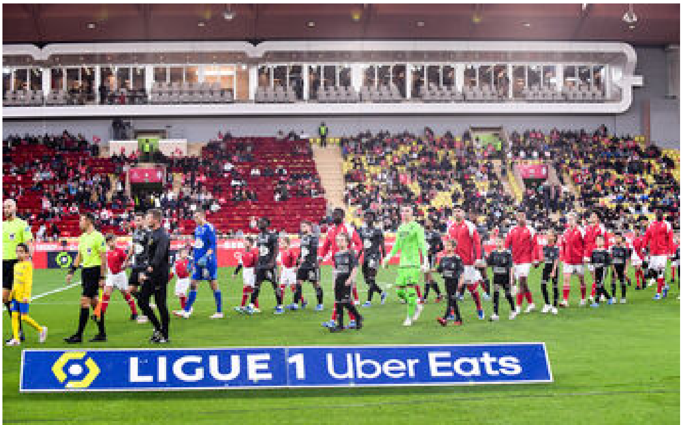
Brest-Monaco : à quelle heure et sur quelle chaîne suivre le match de la 30e journée de Ligue 1 ?