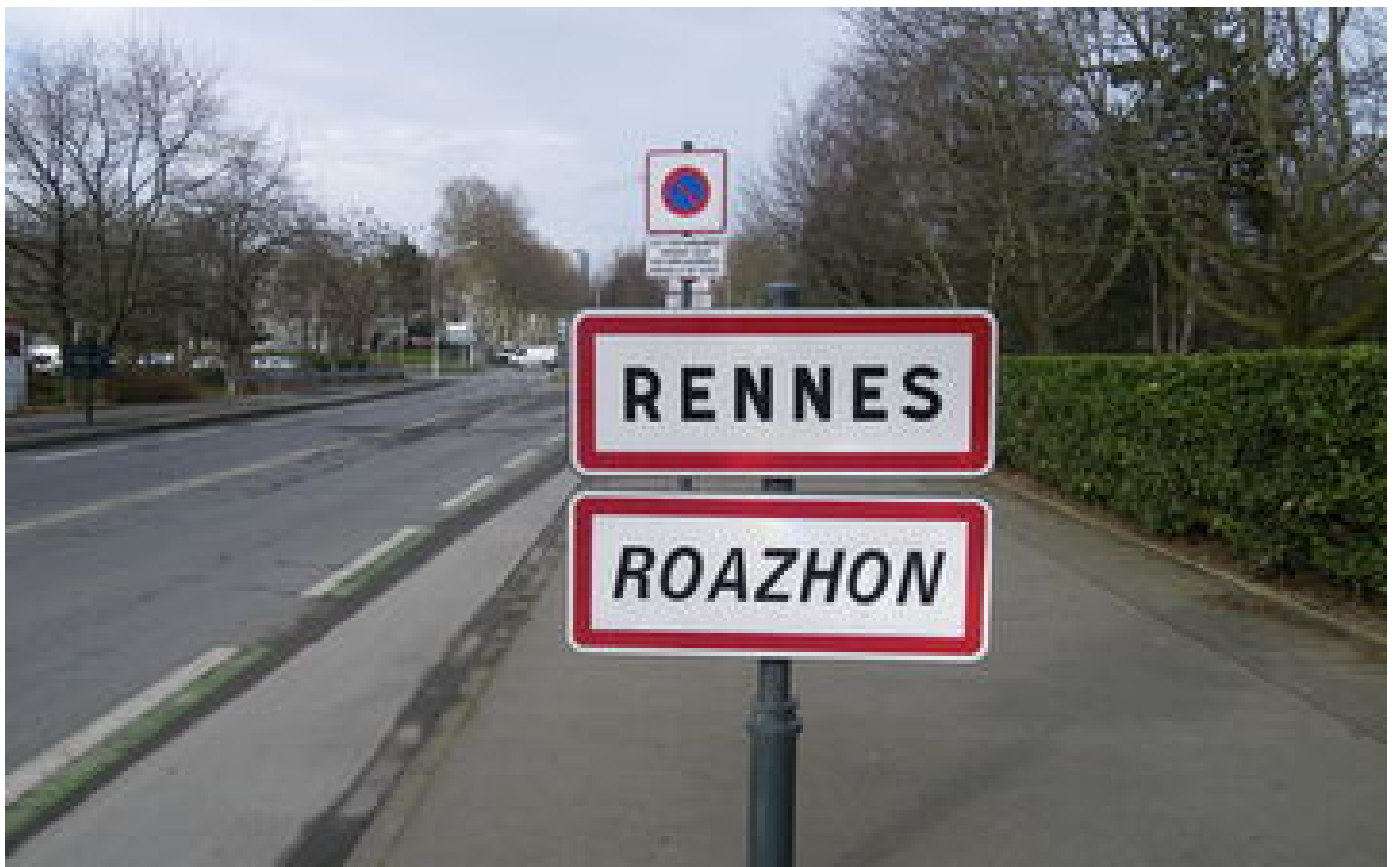
Roazhon, Kraozon, Kemper... Une association saisit l'Unesco pour sauvegarder le nom des lieux-dits en breton