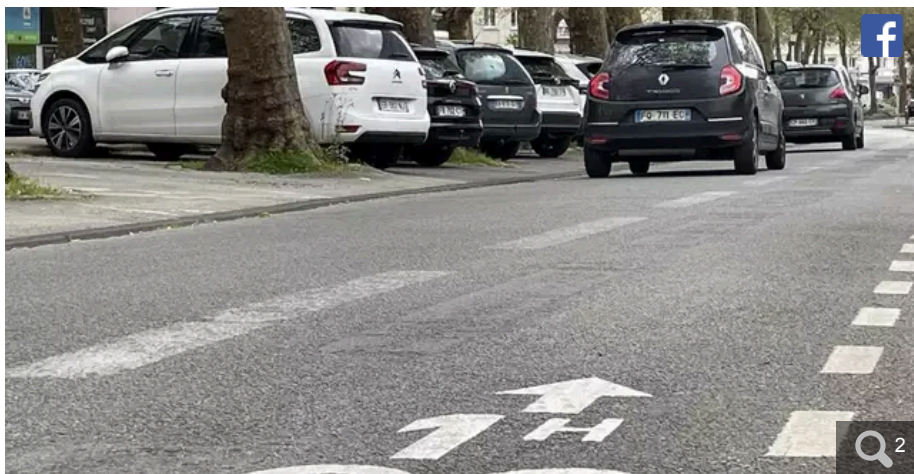
Seul l'îlot sous les arbres boulevard Maréchal-Joffre est concerné par le passage aux trois heures de stationnement autorisé, « les extérieurs » restant à 1 h 30.