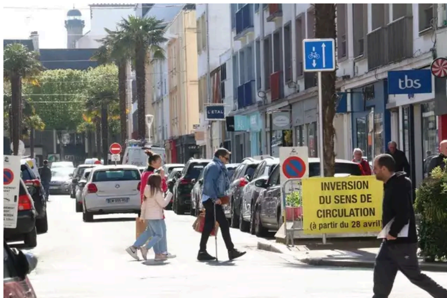
C'est ce dimanche que la rue de Liège change encore de sens.