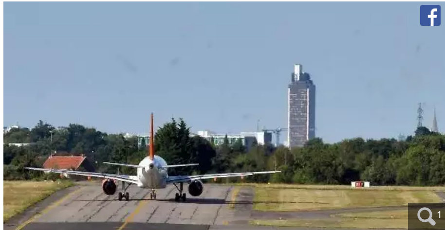
Les syndicats prévoient sur une mobilisation record des aiguilleurs du ciel, jeudi 25 avril 2024.