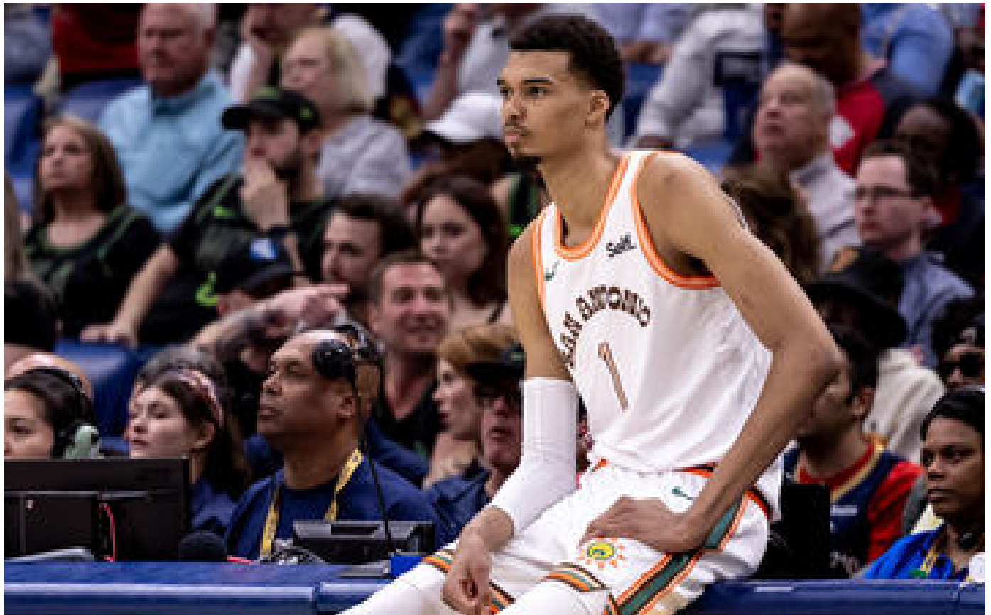
Repos, lecture, Lego, boulot... le programme de Victor Wembanyama jusqu'aux JO de Paris 2024 P