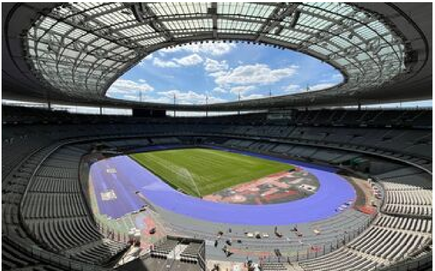
JO Paris 2024 : le Stade de France dévoile sa piste d'athlétisme violette flamboyante