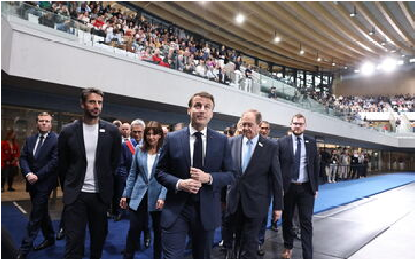
À l'approche des JO de Paris, Emmanuel Macron sur une ligne de crête P