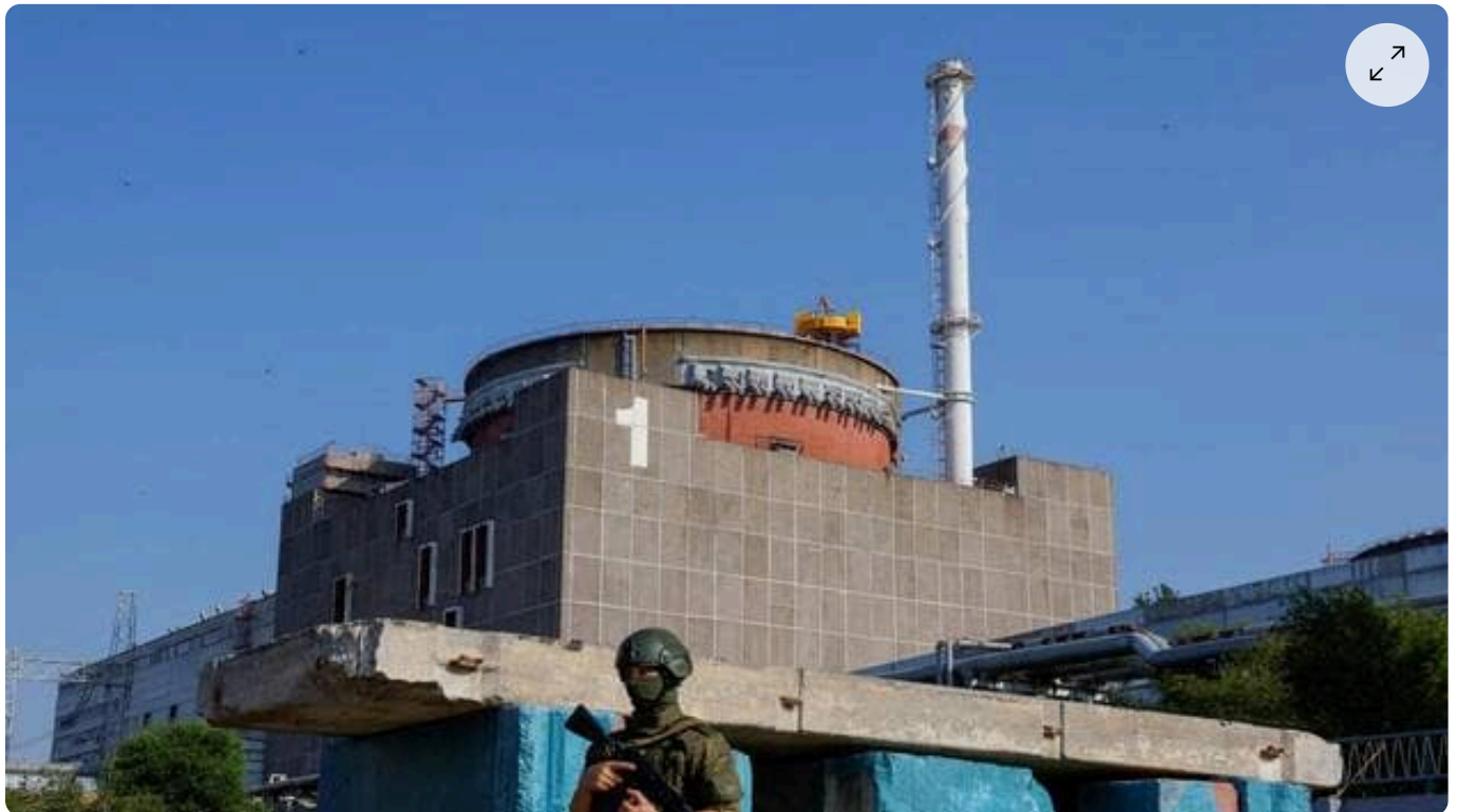
La centrale de Zaporijjia a été touchée par des attaques de drones.